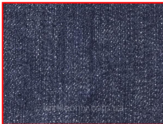
Фото № № 7-9. Збільшене зображення фрагментів одягу невідомого трупа, виявленого 05.11.2020 на другому поверсі в недобудованій будівлі по пр. Нахімова, 156