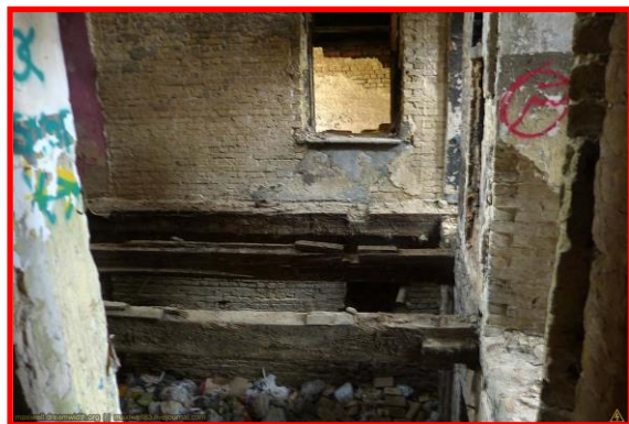
Карта та фото місця перевірки – двоповерхова покинута (недобудована) будівля, розташована за адресом м. Маріуполь, пр-т Нахімова, 156.