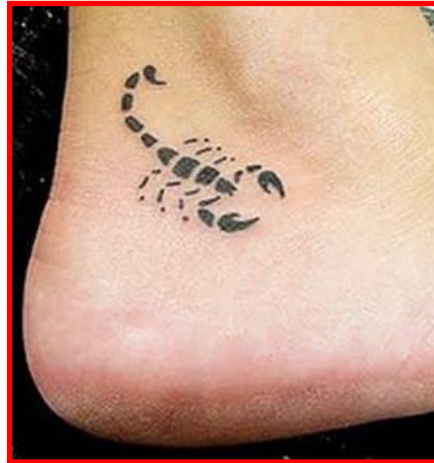
Фото № 6. Зображення татуювання на правій щиколотці невідомого трупа, виявленого 05.11.2020 на другому поверсі в недобудованій будівлі по пр. Нахімова, 156