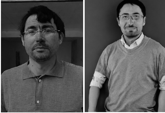
Фототаблиця 5. Зпроектований портрет обвинуваченого у злочині проти безпеки виробництва по галузям (“азійський варіант”).