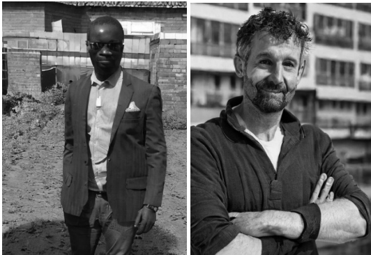
Фототаблиця 6. Зпроектований портрет обвинуваченого у злочині проти безпеки виробництва по галузям (“африканський та європейський варіанти”).

Нас також зацікавив портрет обвинуваченого, що зайнятий у сільськогосподарському виробництві або має фермерське господарство та, окрім того, найрідкіснішого випадку: обвинуваченого жіночої статі.