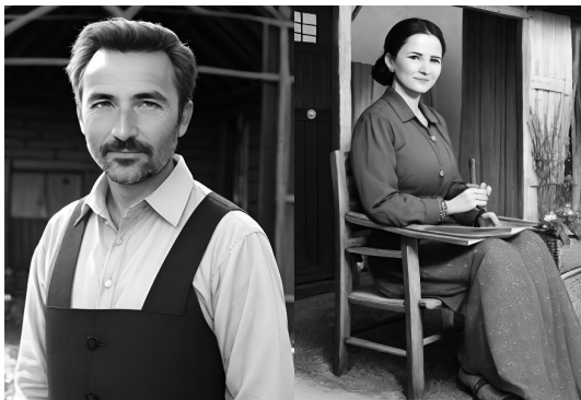
Фототаблиця 7. Зпроекований портрет обвинуваченого у злочині проти безпеки виробництва (у сфері сільського господарства та жіночої статі).

Результати, за версією нейромережі Dream by Wombo, приведені у фототаблиці нижче.