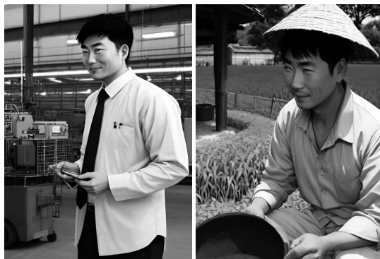
Фототаблиця 3. Зпроектований портрет обвинуваченого у злочині проти безпеки виробництва по галузям (“азійський варіант”).

І негроїдний їх варіант (див. фототаблицю 4).