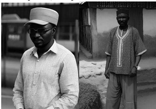
Фототаблиця 4. Зпроектований портрет обвинуваченого у злочині проти безпеки виробництва по галузям (“африканський варіант”).

І негроїдний їх варіант (див. фототаблицю 4).