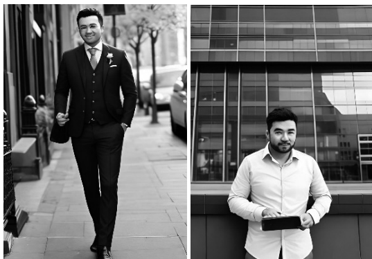
Фототаблиця 1. Зпроекований портрет обвинуваченого у злочині проти безпеки виробництва (загальний вигляд).

По галузям виробництва обвинувачений має виглядати наступним чином (див. фототаблицю 2).