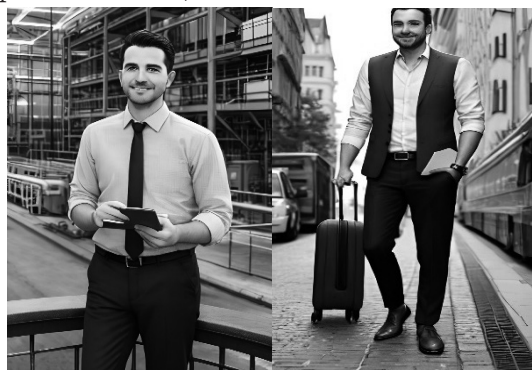
Фототаблиця 2. Зпроекований портрет обвинуваченого у злочині проти безпеки виробництва (ліворуч — промислове виробництво, праворуч — галузь транспорту).

По галузям виробництва обвинувачений має виглядати наступним чином (див. фототаблицю 2).