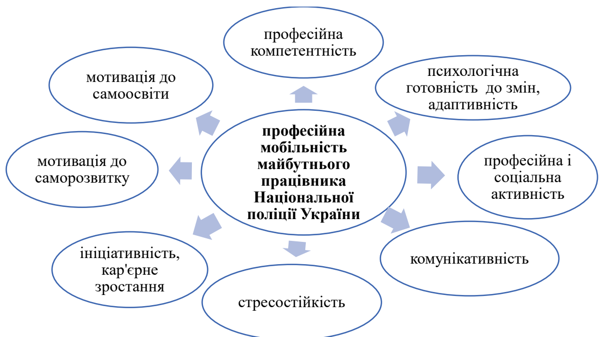
Рис. 1. Складові професійної мобільності майбутніх фахівців для підрозділів Національної поліції України

Ці складові є основою для формування високого рівня професійної мобільності майбутніх поліцейських, що дозволяє їм адаптуватися до змінних умов служби та виконувати свої обов'язки на високому рівні.