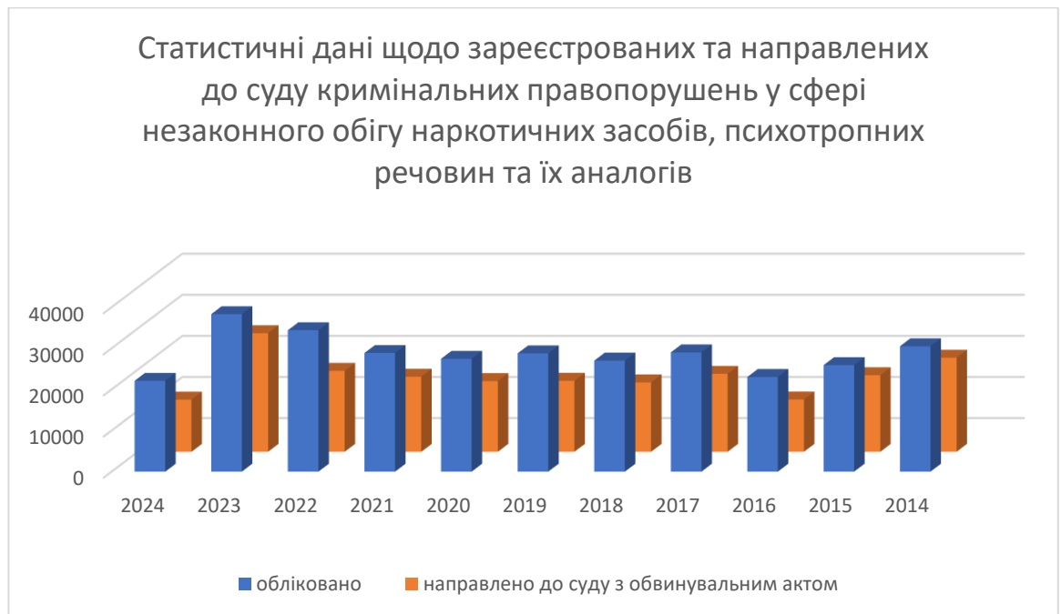
Рис. 1. Статистичні дані щодо зареєстрованих та направлених до суду кримінальних правопорушень у сфері незаконного обігу наркотичних засобів, психотропних речовин та їх аналогів.

Для зручності сприйняття наданої статистичної інформації зазначені дані було переведено у діаграму (рис. 1):