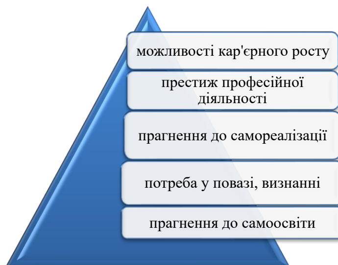
Рис.2. Структура мотивів праці

Під мотивами зазвичай розуміють усвідомлені потреби, активні рушійні сили, що визначають нашу поведінку.