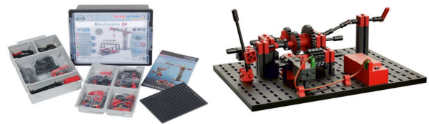
Рис. 1 Комплект «Mechanics 2.0»

Навчальні матеріали з інноваційних технологій допоможуть здобувачам освіти навчатися технічним концепціям STEM-освіти.