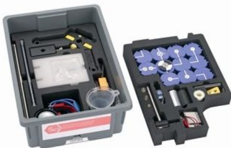
Рис. 5. Комплект TESS Advanced Applied Sciences Basic Set ( URL )

Переваги комплекту: обладнання зберігається в міцній, штабельній і компактній коробці; всі теми охоплюються згідно з міжнародною навчальною програмою розвитку STEM-навчання; розкриває міждисциплінарне навчання; використовується інтерактивна експериментальна процедура з використанням interTESS; разом з двома додатковими компонентами виконуватимуться понад 30 додаткових експериментів, що охоплюють технологію сонячної, вітрової, водної енергії та паливних елементів.