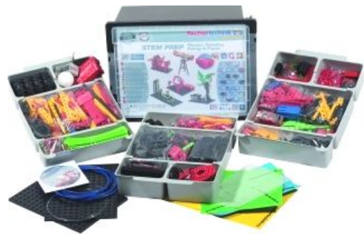
Рис. 6. Комплект STEM-Set-electricity, electronics, energy, power ( URL )

Набір включає наступні теми: розкриття поняття енергії, системи перетворення енергії, перетворення та зберігання енергетичних механізмів, людина і машина, вступ до датчиків робототехніки, системи цифрового зв'язку та програмування.