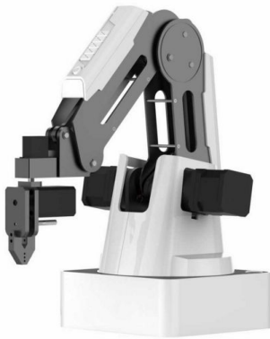
Рис.7. Комплект «DOBOT Robotic arm (3D print, gripping, writing, suction)

різними кінцевими інструментами, рука робота може реалізувати такі функції промислового типу, як 3D-друк, лазерна гравіровка, написання та малювання. Він підтримує вторинні розробки на 13 розширюваних інтерфейсів і більше 20 мов програмування, що підвищує творчість студентів до інженерного та технічного навчання.