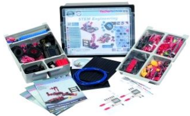
Рис. 3 Комплект «STEM Engineering, fischertechnik»

Набір складається з 890 деталей, розділених на 2 сортувальних ящики та інструкцій з монтажу для 22 моделей. Основні теми для вивчення за допомогою даного комплекту: робототехніка, кібернетика, мехатроніка, автоматизація, механічні системи, системи управління та сенсорні системи, двигуни та ін.