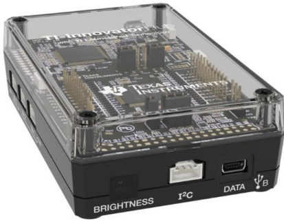
Рис. 4. Комплект TI-Innovator Hub

5. Комплект «Енергія», зокрема комплект TESS Advanced Applied Sciences Basic Set (рис. 5.2.12) основи енергетики та теплової енергії – дозволяє виконати 17 експериментів з наступних тем: