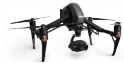
DJI Inspire 2