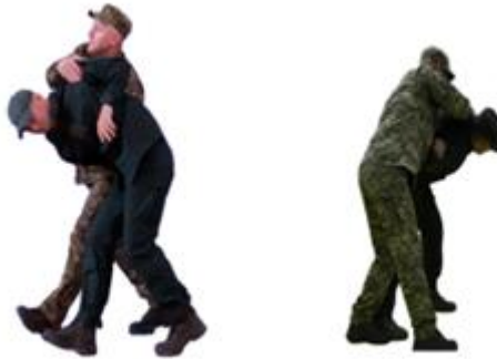
Рис. 123. Конвоювання із застосуванням больового прийому

Конвоювання із застосуванням больового прийому (рис. 123) – загнути руку за спину, захопити за волосся (каска, ніздрі, очні ямки), одяг на протилежному плечі противника, потягнути його на себе і, утримуючи, примусити рухатися в потрібному напрямку.