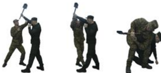
Рис. 104. Обеззброєння при ударі піхотною лопаткою (гумовим кийком) згори

Обеззброєння при ударі піхотною лопаткою (гумовим кийком) згори (рис. 104) – захиститися підставлянням передпліччя руки вгору під озброєну руку противника на замаху, захватити іншою рукою зап'ястя зверху та нанести удар ногою, виконати важіль руки досередини, обеззброїти противника та виконати загин руки за спину.