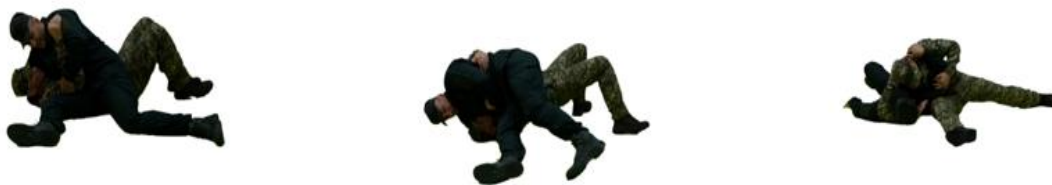
Рис. 93. Захист від утримання збоку

Захист від утримання збоку (рис. 93) – одночасно з різким обертотом в сторону противника притиснути лікоть захопленої руки до свого тулуба, продовжуючи обертання вільною рукою відштовхнути противника в ближнє плече. Виконати утримання з переходом на больовий прийом.