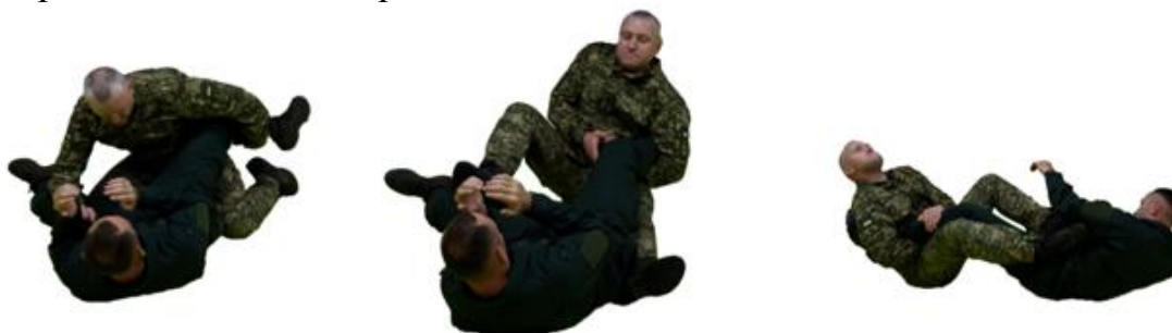
Рис. 37. Ущемлення литкового м'язу

Ущемлення литкового м'язу (рис. 37) – з положення на спині провести передпліччя правої руки під литковим м'язом противника, стегнами охопити атаковану ногу та схрестити ноги, з'єднати руки в замок та відхиленням спини назад провести больовий прийом.