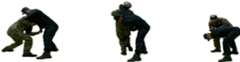
Рис. 91. Захист від задушення у стійці супротивником спереду

Захист від задушення у стійці супротивником спереду (рис. 91) – нанести удар кулаком в пах, звільнитися від задушливого захоплення або виконати кидок (завалювання) противника.