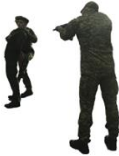
Рис. 120. Обшук у стійці

на коліна: ноги разом, руки за спиною або за головою, погрожуючи зброєю, провести обшук.