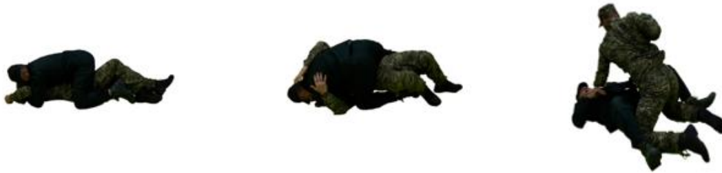
Рис. 87. Захист від вузла плеча