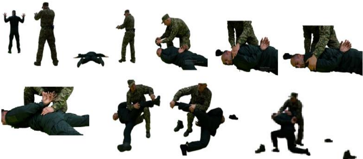
Рис. 122. Обшук у положенні лежачи на землі обличчям униз

Обшук у положенні лежачи на землі обличчям униз (рис. 122) – примусити противника лягти на землю обличчям униз, руки в сторони, ноги разом і, погрожуючи зброєю, провести обшук.