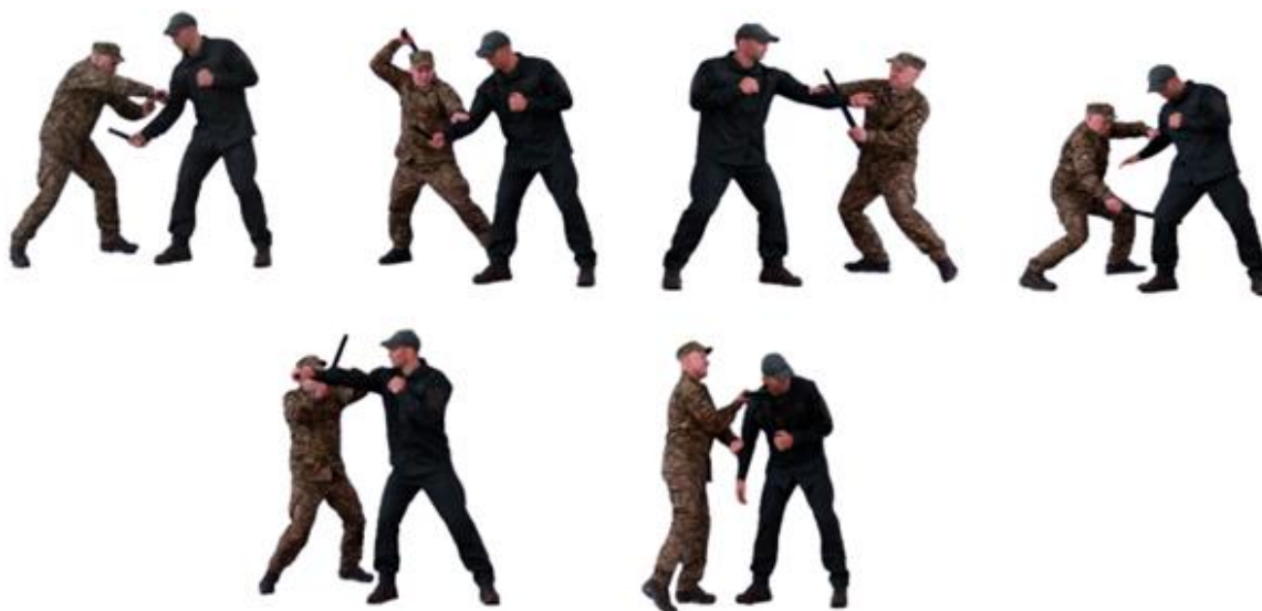
Рис. 111. Захист гумовим кийком при ударах ножом (підручними предметами)