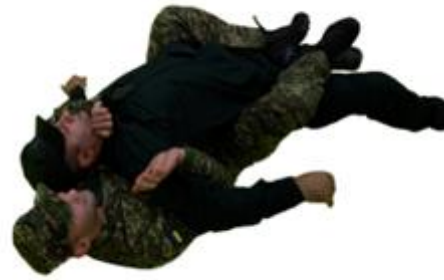
Рис. 53. Утримання зі сторони спини