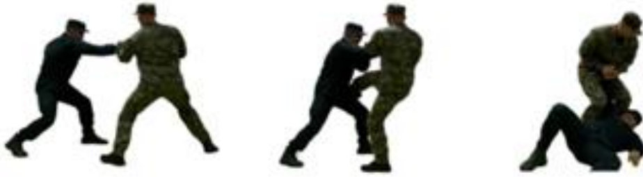
Рис. 100. Обеззброєння при уколi ножем прямо

Обеззброєння при уколi ножем згори (рис. 101) – захиститися підставлянням передпліччя руки вгору під озброєну руку противника на замаху, захватити іншою рукою зап'ястя зверху та нанести удар ногою, виконати важіль руки досередини, обеззброїти противника та виконати загин руки за спину.