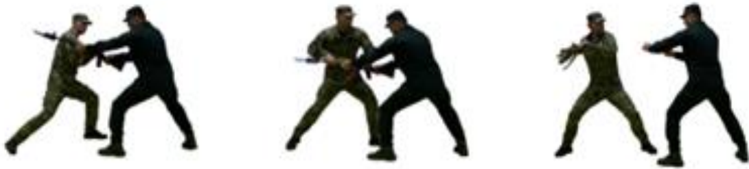
Рис. 97. Обеззброєння при ударі стволом штурмової гвинтівки (уколі багнетом автомата) з відходом ліворуч

праворуч відійти з лінії ураження, захопити руками його зброю, стопою (п'ятою) правої ногою нанести удар в стегно, обеззброїти противника.