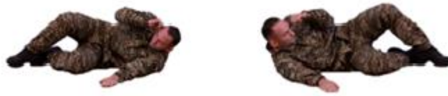
Рис. 20. Самострахування при падінні на бік

ногами і спираючись на долоні, перекотитися через спину вперед, швидко встати і приготуватися до бою.