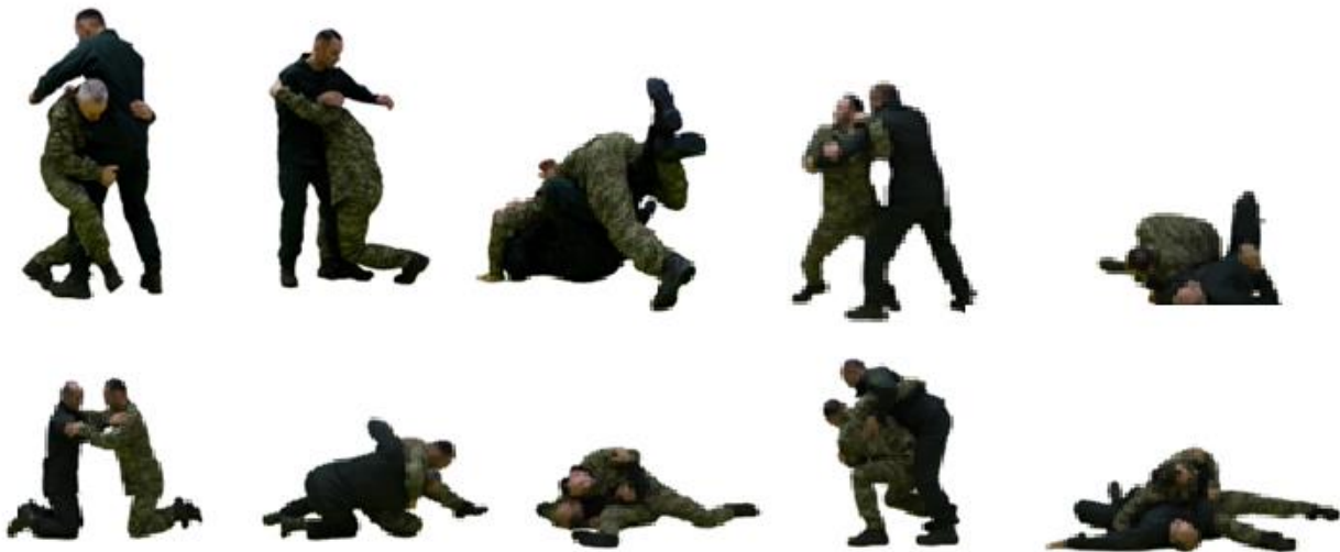
Рис. 57. Завалювання противника різними способами

Завалювання супротивника є одним із основних тактичних прийомів в бою, який дозволяє ефективно знищувати або нейтралізувати агресію супротивника. Ця техніка широко застосовується правоохоронцями, правоохоронцями та спеціальними підрозділами для досягнення переваги у фізичних сутичках. Завалювання полягає в тому, щоб змусити супротивника втратити рівновагу, упасти на землю та вивести його з бою або контролювати його до подальших дій, таких як затримання чи нейтралізація загрози.