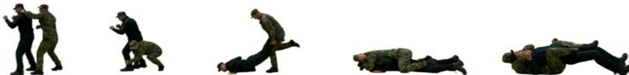
Рис. 44. Кидок із захватом ніг ззаду і задушення

Кидок із захватом ніг ззаду і задушення (рис. 44) – підскочити до противника ззаду і захватити руками його ноги нижче колін, штовхнувши його плечем під сідниці, ривком потягнути ноги на себе вгору та кинути противника на землю і, не випускаючи ніг, ударити носком у пах або живіт, стрибком сісти на поперек противника, виконати задушення.