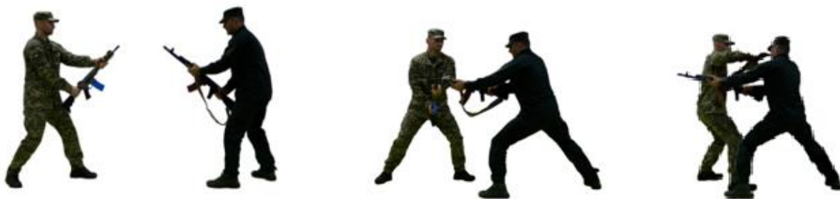
Рис. 64. Відбив стволом штурмової гвинтівкою (автомату) зі зміщенням ліворуч (праворуч)

Відбив стволом штурмової гвинтівкою (автомату) зі зміщенням ліворуч (праворуч) (рис. 64) – з положення готовності до бою, відійти з лінії атаки противника, виконати відбив стволом штурмової гвинтівки (автомату), нейтралізувати загрозу, повернутися в положення готовності до бою.