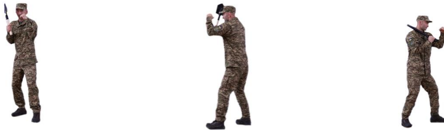
Рис. 3. Приготування до бою з гумовим кийком (піхотною лопатою)