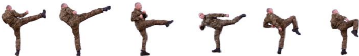
Рис. 26. Удари ногами

Удари ногами (рис. 26): прямо, збоку, знизу, з розворотом удари колінами (знизу, прямо, збоку). Удари руками та ногами в положенні на колінах (лежачи) (рис. 27).