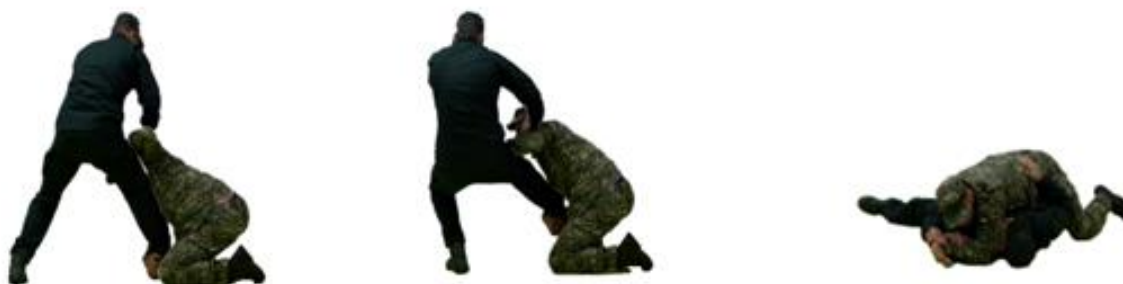
Рис. 49. Атака з колін із переходом на утримання (больові, задушливі) прийоми

Атака з колін із переходом на утримання (больові, задушливі) прийоми (рис. 49) – рукою захопити п'яту противника зсередини, іншу руку накласти на стегно противника та рухом вперед виконати перевід на утримання (виконати больовий або задушливий прийом).