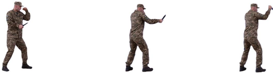
Рис. 2. Приготування до бою з ножом

нахилити вперед, ствол штурмової гвинтівки (автомата) утримувати на рівні підборіддя.