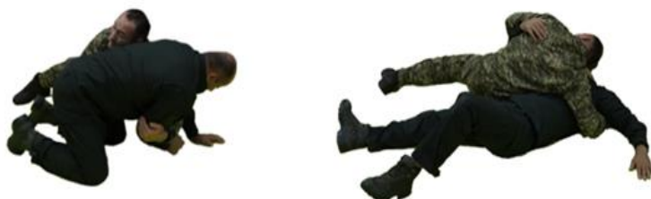
Рис. 55. Перевертання захватом двох рук (рукавів)