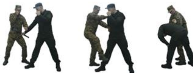
Рис. 105. Обеззброєння при ударі піхотною лопаткою (гумовим кийком) знизу

Обеззброєння при ударі піхотною лопаткою (гумовим кийком) знизу (рис. 105) – з кроком лівої ноги вперед ліворуч, блокувати озброєну руку противника (передпліччям донизу), захопити іншою рукою одяг зверху біля ліктя, нанести удар ногою в пах, виконати загин руки за спину та обеззброєння.