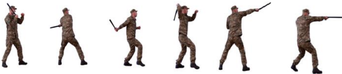
Рис. 67. Удари гумовим кийком

Удари гумовим кийком (рис. 67) - для ударів гумовим кийком приймається бойова стійка, удари наносяться тичком прямо, навідмах, зверху, знизу, комбіновано.