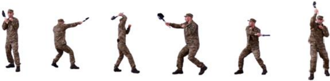
Рис. 66. Удари малою піхотною лопатою

Удари малою піхотною лопатою (рис. 66) - для ударів малою лопатою приймається бойова стійка, удари наносяться з правого і лівого боків, згори по голові і шиї, по тулубу, руках.