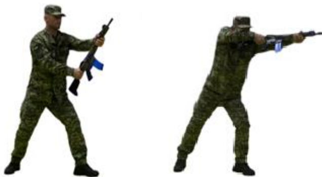
Рис. 58. Тичок стволом без випаду

Тичок стволом без випаду (рис. 58) – швидко випрямивши руки, спрямувати штурмову гвинтівку (автомат) стволом у ціль, уразивши противника, приготуватися до бою на місці або продовжувати рух.