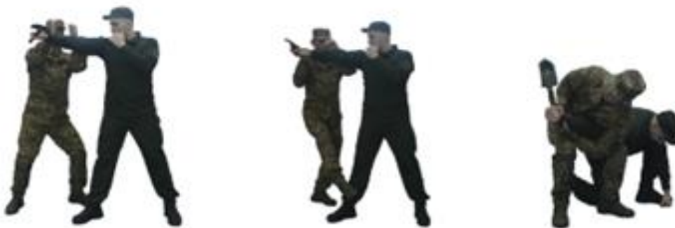
Рис. 107. Обеззброєння при ударі піхотною лопаткою (гумовим кийком) з розмаху (навідліг)

Обеззброєння при ударі піхотною лопаткою (гумовим кийком) з розмаху (навідліг) (рис. 107) – з кроком уперед убік і поворотом до противника захиститися підставлянням передпліччя обох рук під озброєну руку, захопити обома руками передпліччя зверху і нанести удар коліном, скручуючи руку противника вперед вгору, виконати важіль руки досередини, обеззброїти противника.