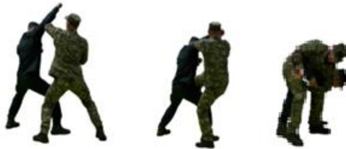
Рис. 101. Обеззброєння при уколi ножем згори

Обеззброєння при уколi ножем згори (рис. 101) – захиститися підставлянням передпліччя руки вгору під озброєну руку противника на замаху, захватити іншою рукою зап'ястя зверху та нанести удар ногою, виконати важіль руки досередини, обеззброїти противника та виконати загин руки за спину.