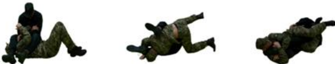
Рис. 88. Захист від ущемлення біцепсу

Захист від ущемлення біцепсу (рис. 88) – підтягнути лікоть атакваної руки, виконуючи оберт перейти на больовий на коліно.