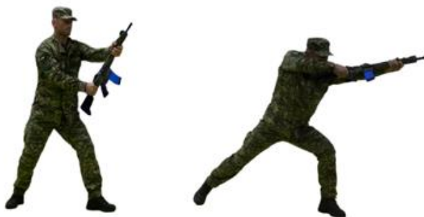
Рис. 59. Тичок стволом з випадом

Тичок стволом з випадом (рис. 59) – спрямувати штурмову гвинтівку (автомат, карабін) стволом у ціль з одночасним поштовхом правої ноги і випадом лівої, уразити противника, повернути зброю (з кроком лівою ногою назад) в початкове положення готовності до бою.