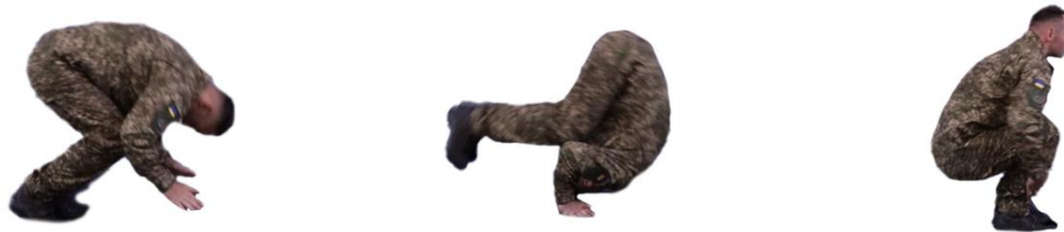
Рис. 21. Перекид уперед

Перекид назад (рис. 22) – з фронтальної стійки сісти, притиснути підборіддя до грудей і, падаючи назад, згрупуватися. У момент торкання землі плечима обпертися об неї руками біля голови, перекотитися назад через голову, швидко встати і приготуватися до бою.