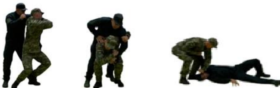
Рис. 42. Кидок через плече

Кидок через плече (рис. 42) - з положення готовності до бою захватити руку противника, нанести удар ногою (рукою) в уразливу точку, вивести противника рівноваги, виконати кидок.