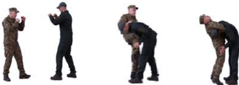
Рис. 39. Задущення у стійці спереду

Задущення у стійці спереду (рис. 39) – з кроком лівої ноги вперед праворуч захопити лівою рукою праву кисть (одяг) противника, правою рукою захопити комір противника, нанести удар коліном в пах, виконати задущення.