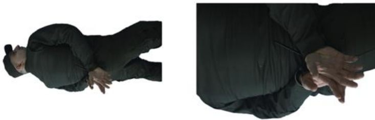
Рис. 116. Зв'язування пластиком хомутом

Надягання кайданків. Способи застосування кайданків визначаються в процесі вирішення конкретних завдань (із метою конвоювання). Для протидії агресивній поведінці затриманого злочинця можуть використовуватися також й інші, більш жорстокіші, заходи, що обмежують рух, включаючи сковування рук, ніг і тулуба. Як правило, кайданки одягають на руки, які знаходяться за спиною (під час конвоювання правопорушника на транспорті кайданки одягаються в положенні спереду). У свою чергу, надягання кайданків проводиться після проведення больових прийомів, кидків чи під загрозою вогнепальної зброї.