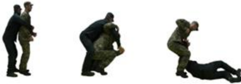
Рис. 76. Визволення від захвату тулуба ззаду разом з руками

противника в сторону нанести удар коліном знизу, виконати звільнення та добивання противника в положенні лежачи.