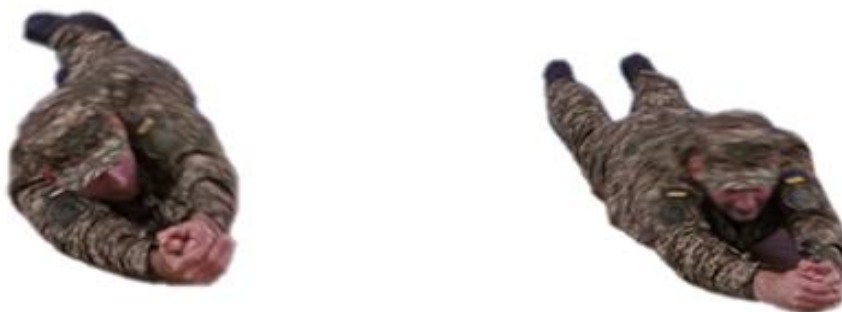
Рис. 16. Перекати через лівий та правий боки

Комбінована техніка: ходьба з переходом на біг, чергування ходьби різними способами з перекатами (переповзаннями), переповзання з переходом на біг.