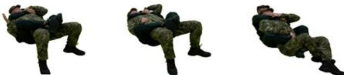
Рис. 92. Захист від задушення супротивником з заду

3) перехід до захисної позиції: успішний захист включає зміну положення для звільнення від атакуючої сили або для переходу в іншу форму боротьби, що дозволяє зберегти контроль над ситуацією.