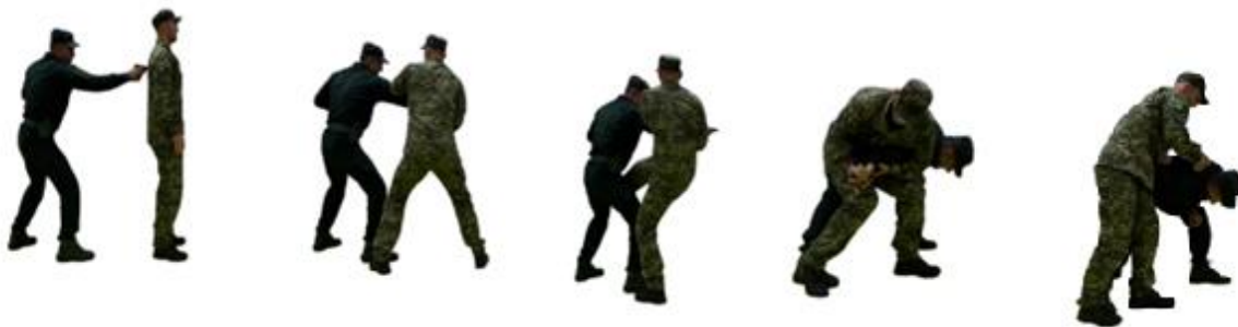
Рис. 110. Обеззброєння при погрозі пістолетом впритул ззаду

Захист гумовим кийком при ударах ножом (підручними предметами) (рис. 111).