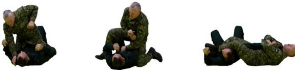
Рис. 31. Важіль ліктя

Важіль ліктя (рис. 31) – підтягуючи руку противника на себе-вгору та випрямляючи її, переступаємо лівою ногою через його шию і притискаємо нею шию, а правою – через груди, одночасно сідаючи на килим і притискаючи його руку стегнами. Продовжуючи тягнути випрямлену руку суперника на себе-вниз, посилюючи больовий ефект рухом тазу вгору і утримуючи обома ногами.