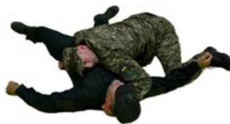
Рис. 51. Утримання поперек