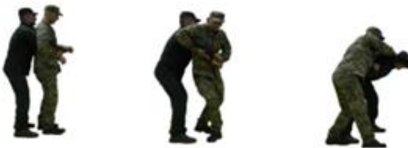
Рис. 75. Визволення від захвату тулуба ззаду без рук

Визволення від захвату тулуба ззаду без рук (рис. 75) – натиснути кулаком на зовнішню частину зап'ястя однієї із рук противника, нанести удар каблуком по гомілці (стопі) або потилицею в обличчя, захопити кисть противника обома руками і повертаючи її всередину, виконати загин руки за спину.