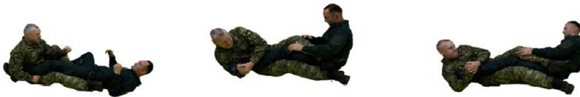
Рис. 36. Скручування п'яти

Скручування п'яти (рис. 36) – захопивши праву ногу противника під пахву, підвести променеву кістку лівої руки під п'яту противника. Праву руку провести над берцовою кісткою противника та захопити руки в захват. Своїми ногами обхопити з обох боків своїми стегнами захоплену ногу противника. Відводячи праве плече назад, скрутити п'яту.