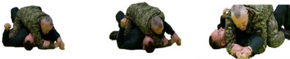
Рис. 32. Вузол плеча

Вузол плеча (рис. 32) – з положення лежачи на противнику захопити зап'ясток руки, вільною рукою захопити власний зап'ясток, блокуючи руку противника в вузол, поступово піднімаючи лікоть створити больовий вплив.