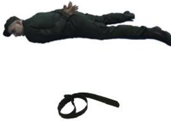
Рис. 115. Зв'язування поясим ременем