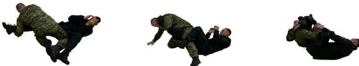
Рис. 35. Важіль коліна

Важіль коліна (рис. 35) - просунувши праву ногу між ногами суперника, захопіть своєю стопою підколінний згин його лівої ноги зсередини. Відштовхуючись лівою ногою від килима поштовхом правої праворуч – униз, звалити суперника на бік. Притиснувши його тазом до килима, захопити п'яту ноги своєю рукою. Міцно стиснувши стегнами ногу суперника вище коліна, захопити атаковану ногу своєю правою рукою. Посилення ефекту досягають прогинанням атакуючого в спині, протиснувшись усім тулубом до його ноги.