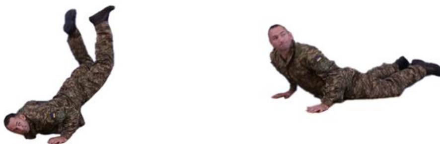
Рис. 18. Самострахування при падінні вперед

Самострахування при падінні назад (рис. 19) – з вихідного положення сісти ближче до п'ят, згрупуватися (руки вперед долонями вниз); перекочуючись на спині назад, зробити попереджувальний удар прямими, трохи розведеними руками об землю, піднятися і приготуватися до бою.