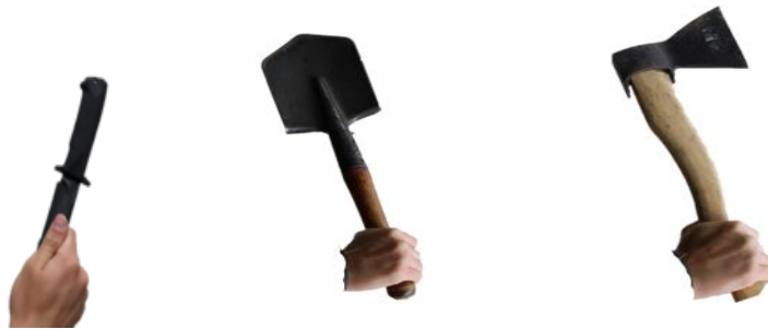
Рис. 126. Види хватів «холодної зброї»

Для метання можна використовувати будь-які гострі предмети: цвяхи, леза бритви, ніж, сокиру, саперну лопатку та інші колючі предмети. Захоплення холодної зброї для метання здійснюється за більш легку його частину: лезо, топорище, руків'я (рис. 126).