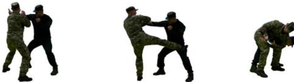
Рис. 103. Обеззброєння при уколi ножем збоку

скручуючи руку противника, виконати важіль руки досередини, обеззброїти противника.