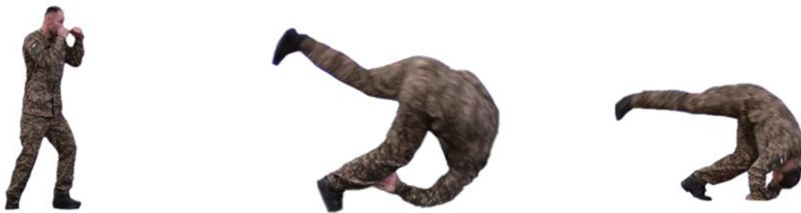
Рис. 23. Перекид через плече

Акробатичні вправи (рис. 24) – рандат, гімнастичне колесо.