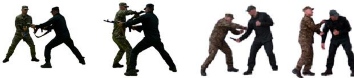
Рис. 96. Відбиття стволом штурмової гвинтівки (автомата)

Відбиття стволом штурмової гвинтівки (автомата) (рис. 96) – нанести удар кінцем ствола (багнетом) по зброї противника (справа, зліва або вниз вправо чи вліво); після відбиття атаки провести контратаку у відповідь; піхотною лопатою (гумовим кийком).