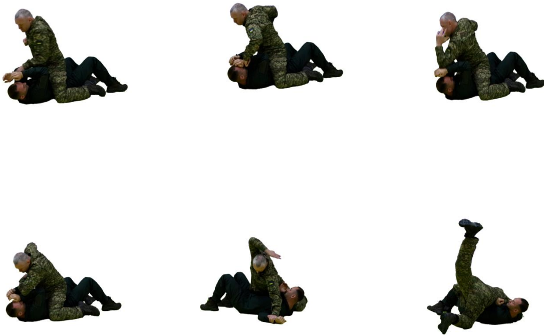
Рис. 27. Удари руками та ногами в положенні на колінах (лежачи)

Комбінована ударно-кидкова техніка (удари руками та ногами у поєднанні з кидками).