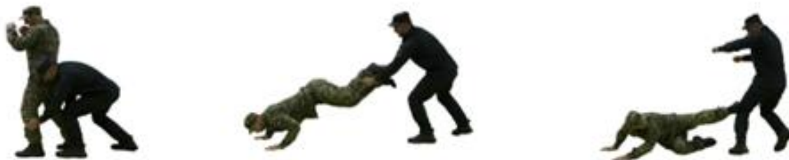
Рис. 78. Визволення від захвату ніг ззаду

Визволення від захвату ніг ззаду (рис. 78) – падаючи вперед на руки, звільнитися від захвату і нанести супротивнику удар ногою в уразливу точку на тілі.