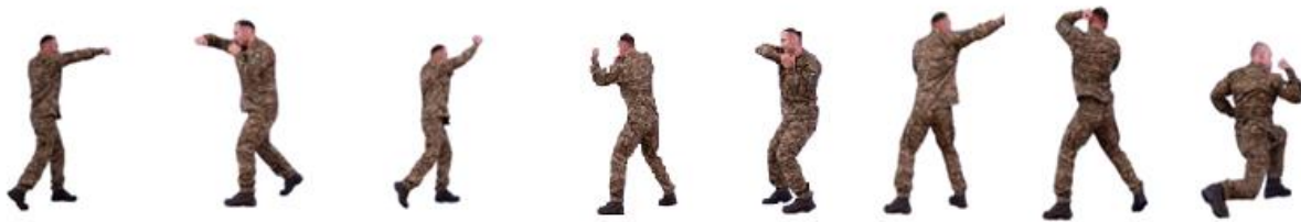
Рис. 25. Удари руками

Удари руками (рис. 25): прямо, збоку, зверху, знизу, навідмах; удари ліктями (збоку, знизу, зверху, навідмах), збільшення сили ударів досягається енергійним рухом ніг і тулуба.