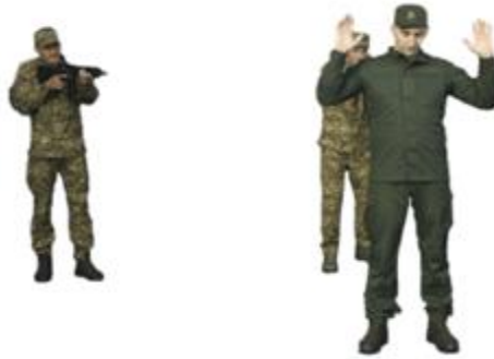
Рис. 125. Конвоювання при супроводженні підозрюваного пішим порядком