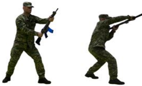
Рис. 60. Удар прикладом збоку

штурмової гвинтівки (автомату, карабіна) в уразливу точку противника, повернутися в положення готовності до бою.