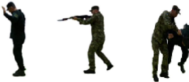
Рис. 124. Конвоювання при погрозі зброї

Конвоювання при погрозі зброї (рис. 124) – погрожуючи зброєю і знаходячись на відстані 3 – 5 кроків, позбавляючи цим противника можливості застосувати прийом обеззброєння, супроводжувати його в потрібному напрямку.