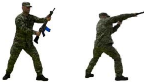
Рис. 63. Удар тильною частиною прикладу

гвинтівкою (автомату), швидким рухом вперед виконати удар тильною частиною прикладу гвинтівки (автомата) в уразливу точку на тілі противника, повернутися в положення готовності до бою.