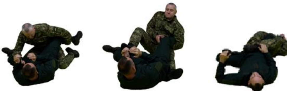
Рис. 34. Ущемлення Ахіллового сухожилля

Ущемлення Ахіллового сухожилля (рис. 34) – захопити ногу суперника рукою між передпліччям і плечем, лягти на спину, міцно обхопивши ногу суперника ногами нижче коліна. Ребром нижньої частини передпліччя натиснути на місце з'єднання ахіллового сухожилля з п'ятковою кісткою.