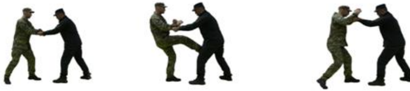
Рис. 70. Визволення від захвату рукавів

Визволення від захвату рукавів (рис. 70) – з нанесенням удару в пах противника обвести свої руки навколо рук противника, закручуючи одяг навколо пальців, і силою смикнути в сторони.