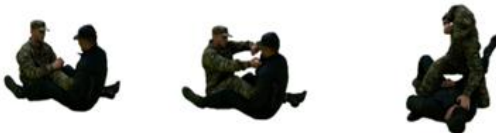
Рис. 89. Захист від ущемлення Ахіллового сухожилля

Захист від ущемлення Ахіллового сухожилля (рис. 89) – стопу атакованої ноги натягнути на себе, руками захопити одяг противника та просунути ногу максимально вперед, перевернути противника на спину, виконати добивання.