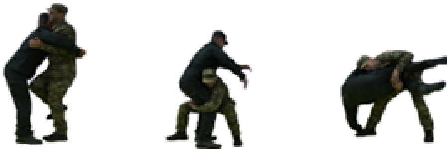
Рис. 74. Визволення від захвату тулуба спереду разом з руками

Визволення від захвату тулуба ззаду без рук (рис. 75) – натиснути кулаком на зовнішню частину зап'ястя однієї із рук противника, нанести удар каблуком по гомілці (стопі) або потилицею в обличчя, захопити кисть противника обома руками і повертаючи її всередину, виконати загин руки за спину.