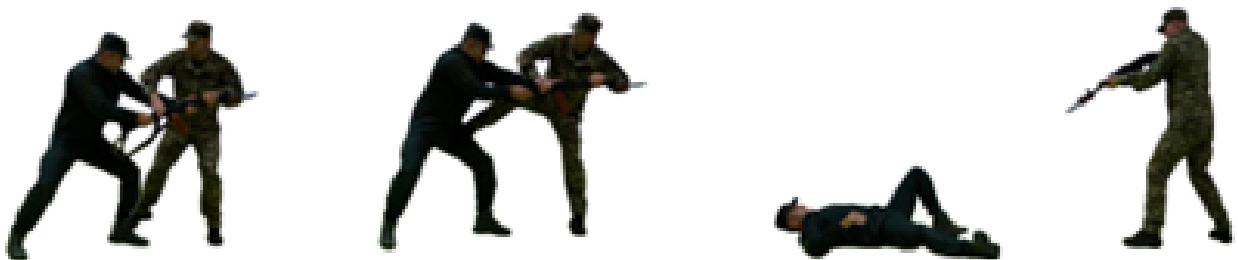
Рис. 98. Обеззброєння при ударі стволом штурмової гвинтівки (уколі багнетом автомата) з відходом праворуч