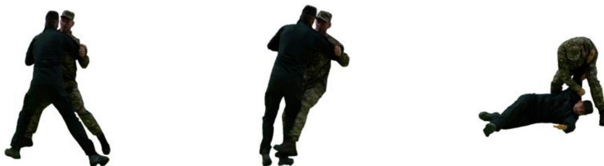
Рис. 45. Бокова підсічка

Бокова підсічка (рис. 45) – правою рукою захопити ліву руку противника ближче до ліктя, лівою рукою захопити за комір. З кроком лівої ноги в сторону, руками вивести противника з рівноваги та стопою правої ноги виконати підсічку під ліву гомілку противника у темп кроку.