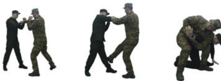
Рис. 29. Важіль руки всередину

Важіль руки всередину (рис. 29) – відійти з лінії ураження (вперед - ліворуч), захопити правою рукою за однойменну кисть противника, одночасно із нанесенням удару правою ногою в уразливу точку, лівою рукою нанести удар в його ліктювий суглоб, виконати важіль руки всередину з больовим контролем правої кисті противника.