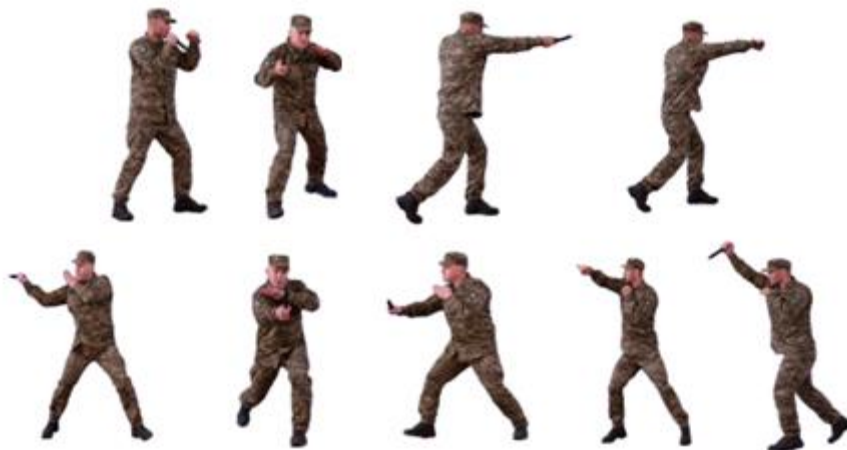
Рис. 65. Уколи (удари, порізи ножем)

Уколи (удари, порізи ножем) (рис. 65) – уколи ножем завдаються з коротким замахом згори, збоку, навідліг, знизу в шию, у верхню частину тулуба, у живіт, в ділянку поперек (незахищені ділянки тіла противника).