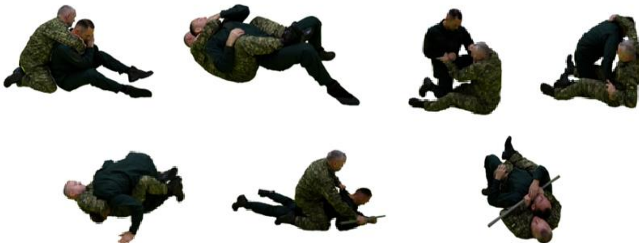
Рис. 40. Задущливі прийоми в партері

Задущливі прийоми в партері (рис. 40) (руками, за допомогою одягу, за допомогою інших предметів).