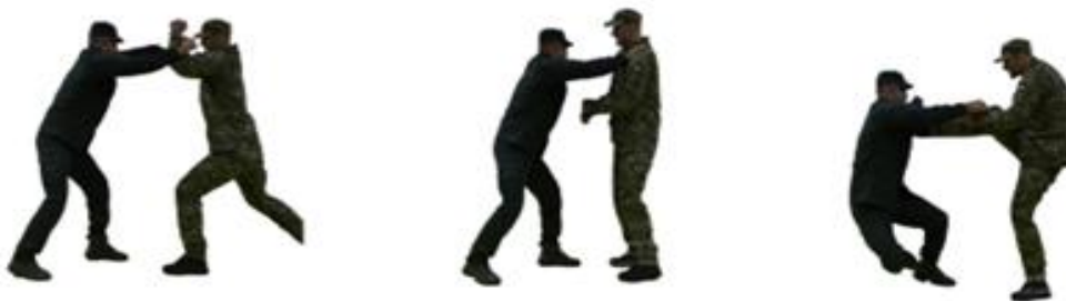
Рис. 71. Визволення від захвату горла спереду або одягу на грудях

Визволення від захвату горла спереду або одягу на грудях (рис. 71) – з'єднати разом стиснуті кулаки обох рук і розвівши лікті в сторони завдати різкий удар між рук противника знизу догори.