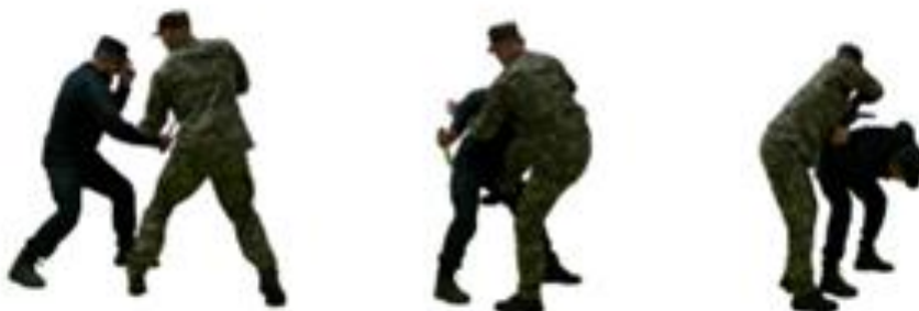
Рис. 99. Обеззброєння при уколі ножом знизу

Обеззброєння при уколі ножом знизу (рис. 99) – з кроком лівої ноги вперед ліворуч, блокувати озброєну руку противника (передпліччям донизу), захопити іншою рукою одяг зверху біля ліктя, нанести удар ногою в пах, виконати загин руки за спину та обеззброєння.