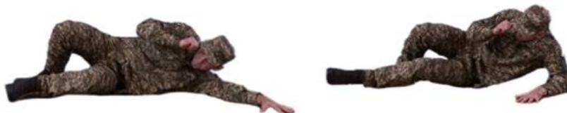
Рис. 14. Переповзання на боці

На спині (рис. 15) - лежачи на спині ноги зігнуті в колінах, ноги по черзі відштовхуються від підлоги створюючи рух в перед. Одночасно руки можуть відштовхуватися від підлоги, допомагаючи тягнути тіло в перед.