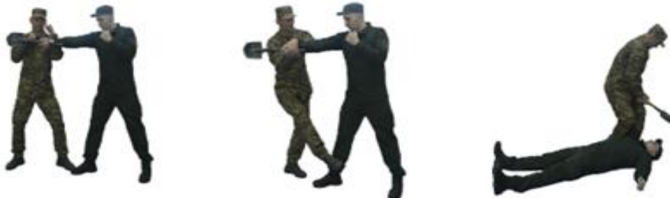
Рис. 106. Обеззброєння при ударі піхотною лопаткою (гумовим кийком) прямо

Обеззброєння при ударі піхотною лопаткою (гумовим кийком) прямо (рис. 106) – з кроком лівої ноги вперед ліворуч відійти з лінії ураження, відбити лівою рукою озброєну руку противника та захопити її обома руками (за кисть), нанести удар ногою в уразливу точку, виконати важіль руки назовні та обеззброєння.