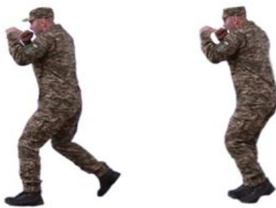
Рис. 8. Пересування підкроком

відштовхування ногу згинають у коліні, виносять уперед і ставлять на землю (на всю стопу або підбор з перекатом на носок);