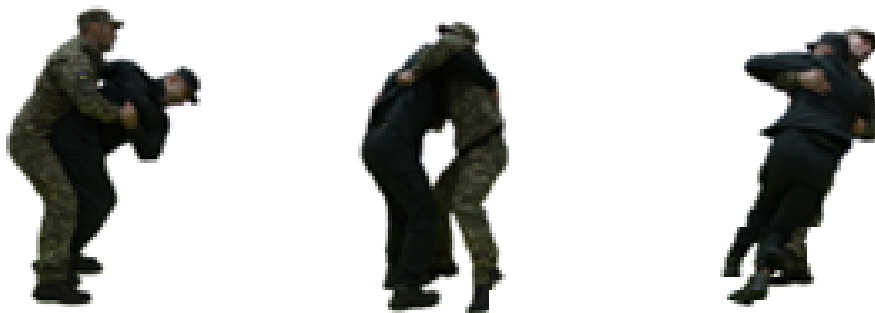
Рис. 81. Захист від кидка через стегно

Захист від кидку із захватом ніг ззаду і задушення (рис. 82) – при захопленні противником ніг виконати самострахування при падінні вперед та нанести супротивнику удар стобою в уразливу точку.