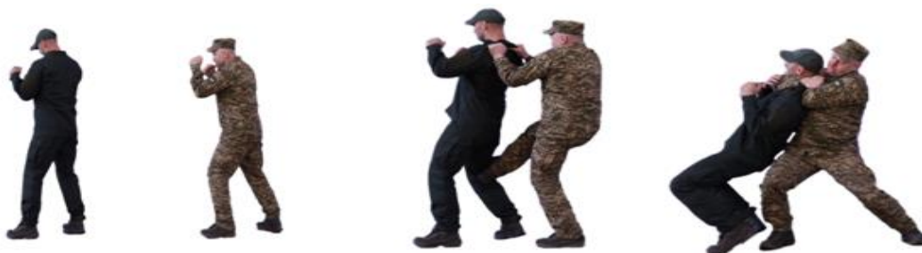
Рис. 38. Задущення у стійці руками з заду

Задущення у стійці спереду (рис. 39) – з кроком лівої ноги вперед праворуч захопити лівою рукою праву кисть (одяг) противника, правою рукою захопити комір противника, нанести удар коліном в пах, виконати задущення.