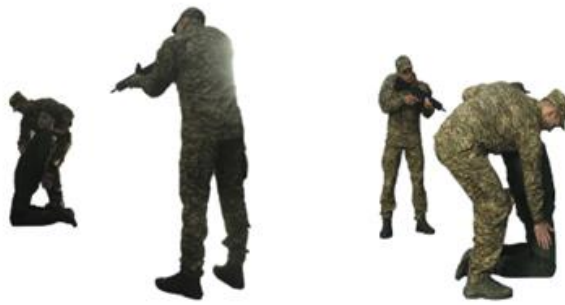
Рис. 121. Обшук у положенні на колінах

Обшук у положенні лежачи на землі обличчям униз (рис. 122) – примусити противника лягти на землю обличчям униз, руки в сторони, ноги разом і, погрожуючи зброєю, провести обшук.