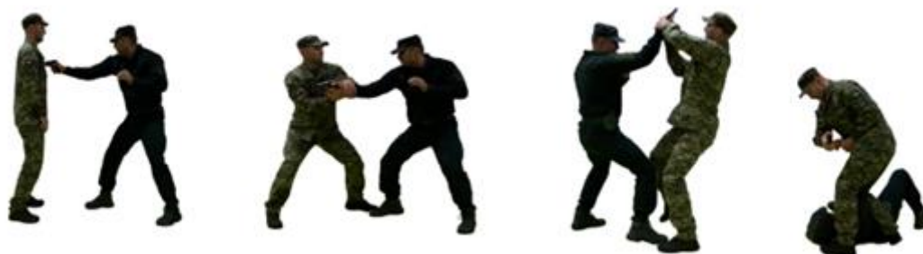
Рис. 109. Обеззброєння при погрозі пістолетом впритул спереду