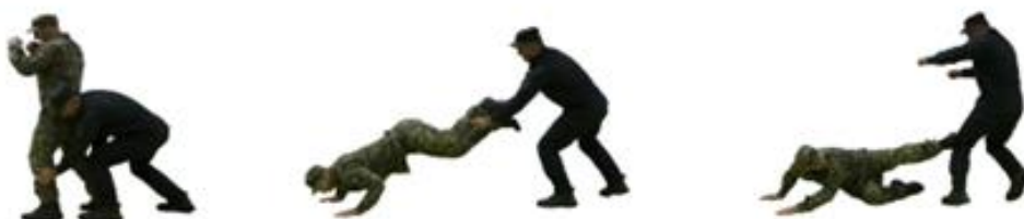
Рис. 82. Захист від кидку із захватом ніг ззаду і задушення

Захист від кидку із захватом ніг ззаду і задушення (рис. 82) – при захопленні противником ніг виконати самострахування при падінні вперед та нанести супротивнику удар стобою в уразливу точку.