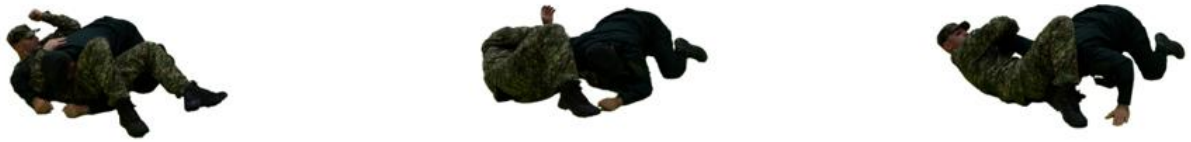
Рис. 94. Захист від утримання поперек

Захист від утримання зверху (рис. 95) - захопити одяг на спині заблокувавши руки, «мостом» виконати переворот, вийти на утримання зі сторони ніг.