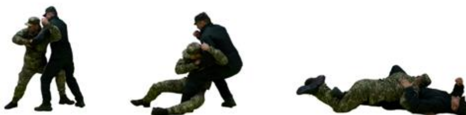
Рис. 46. Зачеп гомілкою зсередини під однойменну ногу

Зачеп гомілкою зсередини під однойменну ногу (рис. 46) – з положення готовності до бою захопити руками одяг противника, нанести удар коліном в пах, лівою ногою виконати зачеп однойменної ноги противника зсередини, виконати кидок.