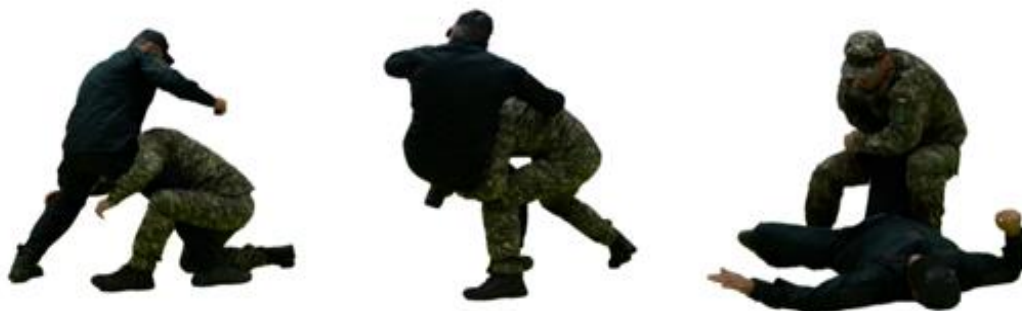
Рис. 48. Атака з колін проходом в ноги противника

Атака з колін проходом в ноги противника (рис. 48) – стоячи на колінах, правою ногою виконати випад перекривши ліву ногу противника, руками охопити ноги з'єднавши руки в замок, голову притиснути до тазу противника з лівого боку, піднімаючись та відводячи його ноги виконати кидок (завалювання).