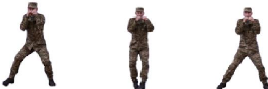
Рис. 11. Переміщення приставним кроком лівим боком, правим боком

Наприклад, під час здійснення атак або контратак правоохоронці можуть спочатку використовувати швидке пересування на відкритій місцевості, а потім переходити на методи пересування в укриттях для забезпечення безпеки.