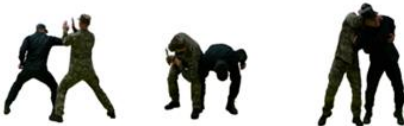
Рис. 102. Обеззброєння при уколi ножем з розмаху (навідліг)

Обеззброєння при уколi ножем з розмаху (навідліг) (рис. 102) – з кроком уперед убік і поворотом до противника захиститися підставлянням передпліччя обох рук під озброєну руку, захватити обома руками передпліччя зверху і нанести удар коліном, скручуючи руку противника вперед вгору, виконати важіль руки досередини, обеззброїти противника.