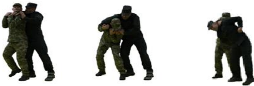
Рис. 72. Визволення від захвату горла ззаду

Визволення від захвату горла ззаду (рис. 72) – захватити лівою рукою кисть, а правою рукою ліктьовий суглоб правої руки противника, швидко присісти і, повертаючись вліво вниз, визволитися від задушливого захвату, одночасно з цим виконати кидок через спину або загин руки противника за спину.