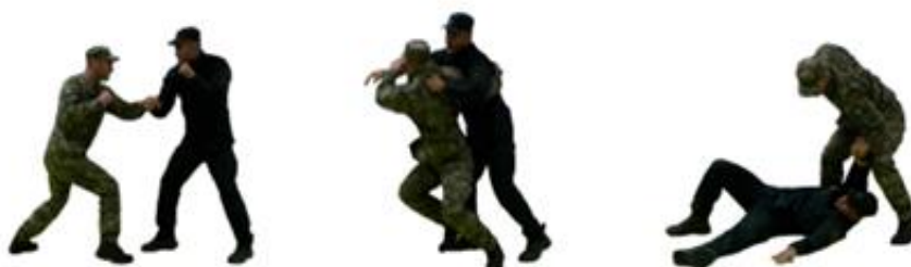
Рис. 43. Кидок через стегно

Кидок через стегно (рис. 43) – захватити лівою рукою праву руку противника біля ліктя, а правою рукою за пояс зі сторони спини або за голову, вивести противника з рівноваги, виконати кидок.