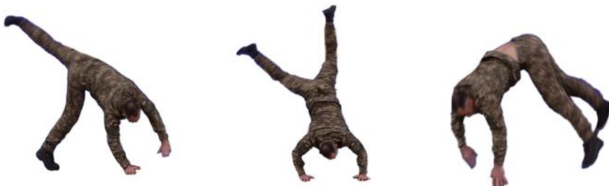
Рис. 24. Акробатичні вправи

Акробатичні вправи (рис. 24) – рандат, гімнастичне колесо.