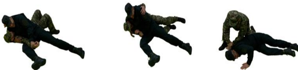
Рис. 86. Захист від важеля ліктя

Захист від важеля ліктя (рис. 86) – розворотом долоні паралельно підлозі зменшити больовий вплив, різким скручуванням на противника витягнути руку, що атакується та повернутись у бойову стійку.