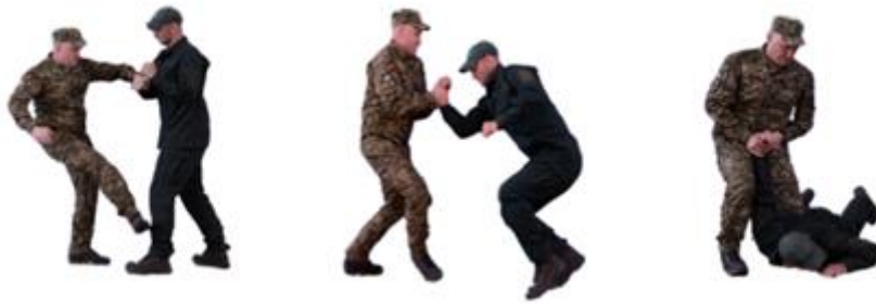
Рис. 30. Важіль руки назовні

Больові прийоми в партері. Коли боротьба переходить в положення лежачи, можливості для застосування більших важелів і контролю за супротивником зростають. У такому положенні застосовуються прийоми на болючі точки суглобів (наприклад, на лікті або колінних суглобах), що дозволяє досягти повного контролю над опонентом. Прийоми в партері особливо ефективні в умовах затримання правопорушників, де правоохоронець чи працівник правоохоронних органів може застосувати мінімум сили, домігшись максимального результату.