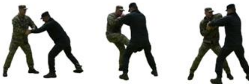
Рис. 69. Визволення від захвату однієї руки

Визволення від захвату однієї руки (рис. 69) – захопити вільною рукою за кулак атакованої руки і з силою смикнути в бік великих пальців рук противника.