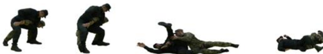
Рис. 85. Захист від важеля руки всередину