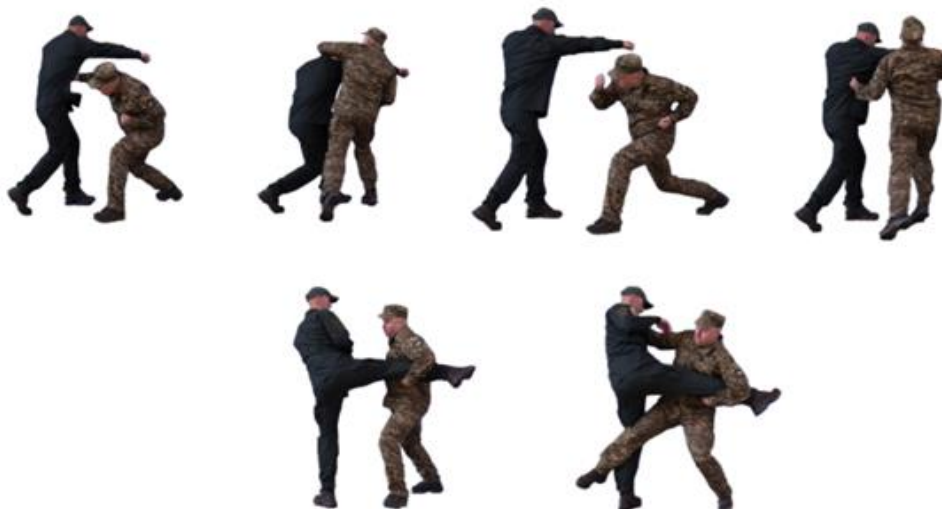
Рис. 68. Захист від ударів руками та ногами

Захист від ударів руками та ногами (рис. 68): захист від ударів рукою противника; захист від удару ногою супротивником.