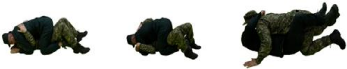
Рис. 95. Захист від утримання зверху

Захист від утримання зверху (рис. 95) - захопити одяг на спині заблокувавши руки, «мостом» виконати переворот, вийти на утримання зі сторони ніг.