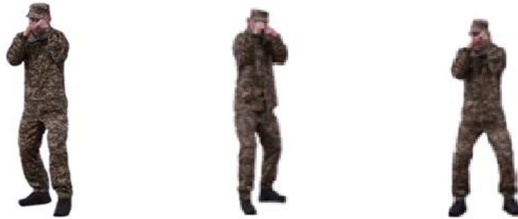
Рис. 5. Бойові стійки

Способи пересування. Способи пересування є важливим аспектом тактичної підготовки правоохоронців, оскільки правильний вибір та ефективне використання різних методів пересування є ключовими для забезпечення безпеки особового складу та виконання оперативних завдань у бойових або нестандартних умовах. Знання способів пересування дозволяє мінімізувати ризики для правоохоронців, зберігаючи їхню мобільність, ефективність і здатність реагувати на зміну обстановки.