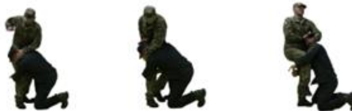
Рис. 77. Визволення від захвату ніг спереду

Визволення від захвату ніг ззаду (рис. 78) – падаючи вперед на руки, звільнитися від захвату і нанести супротивнику удар ногою в уразливу точку на тілі.