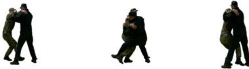
Рис. 47. Зачеп гомілкою зсередини різнойменної ноги

Основні характеристики кидків з різних положень (складники кидків з різних положень надано у табл. 6):