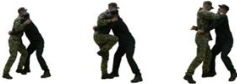
Рис. 73. Визволення від захвату тулуба спереду без рук

Визволення від захвату тулуба спереду разом з руками (рис. 74) – нанести удар в пах або гомілку, різко присісти, розвести руки в сторони і виконати кидок із захватом ніг спереду.