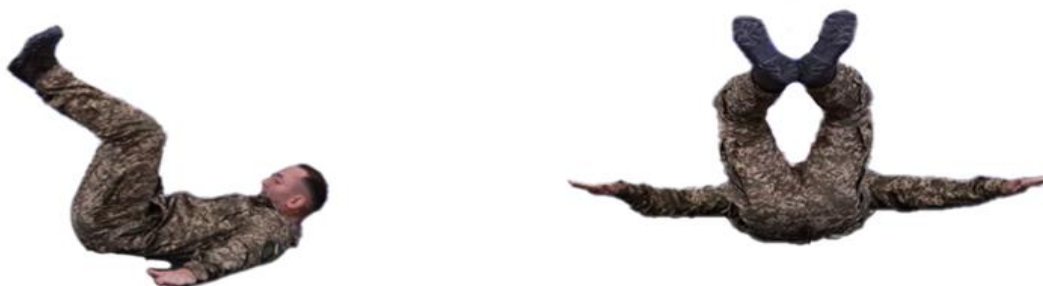
Рис. 19. Самострахування при падінні назад

Самострахування при падінні назад (рис. 19) – з вихідного положення сісти ближче до п'ят, згрупуватися (руки вперед долонями вниз); перекочуючись на спині назад, зробити попереджувальний удар прямими, трохи розведеними руками об землю, піднятися і приготуватися до бою.