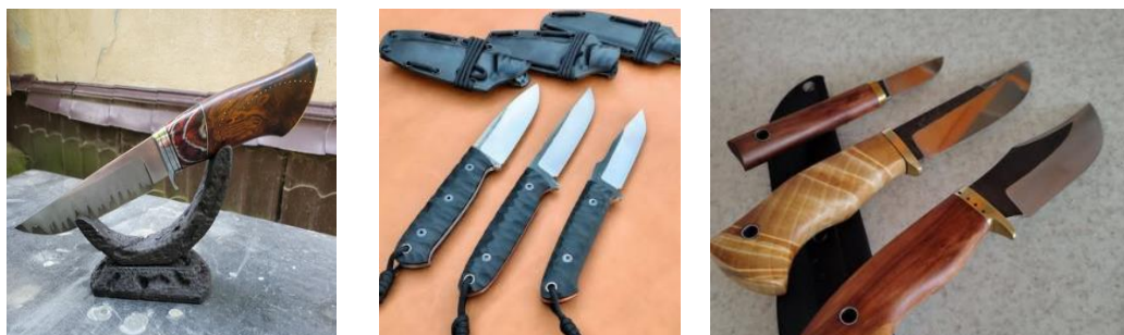
Рис. 112. Українські кастомовані бойові ножі

Бойовий ніж у спецопераціях – це не просто зброя, а інструмент професіонала, що поєднує функціональність, психологічний ефект і символіку. Його використання залишається актуальним навіть у високотехнологічну епоху, адже спеціальні операції завжди мають фактор тиші, ближнього контакту і непередбачуваності.