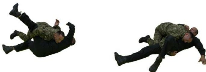
Рис. 56. Перевертання захватом руки та ноги зсередини