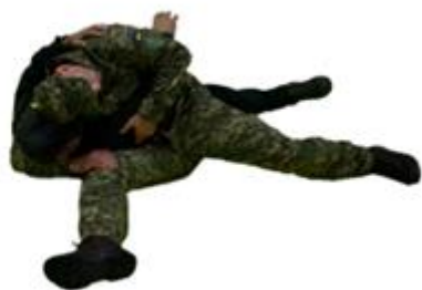
Рис. 50. Утримання збоку

утримання зі сторони спини (рис. 53) – правою рукою захопити під праву руку, а лівою за шию, ногами обхопити тулуб противника.