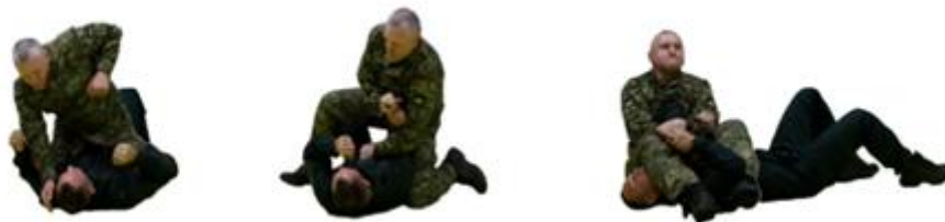
Рис. 33. Ущемлення біцепсу

Ущемлення біцепсу (рис. 33) – підтягуючи руку противника на себе переступаємо лівою ногою через його шию і притискаємо нею шию, а правою – через груди, одночасно сідаючи на килим і притискаючи його руку стегнами. Зігнувши свою руку та зафіксувавши її над біцепсом противника, натискаємо своєю рукою на його м'яз біцепсу, використовуючи його лікоть як точку прикладання сили.