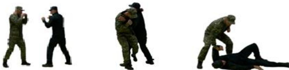
Рис. 41. Задня підніжка

Задня підніжка (рис. 41) – з положення готовності до бою захватити противника за одяг (частини екіпіровки), нанести удар в уразливу його точку, з кроком лівої ноги вперед ліворуч виконати задню підніжку, нанести удар правою ногою.