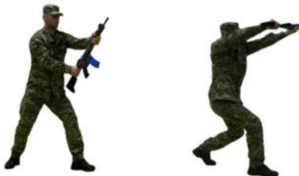
Рис. 62. Удар магазином

Удар магазином (рис. 62) – з положення готовності до бою швидким рухом спрямувати штурмову гвинтівку (автомата) магазином вперед в уразливу точку противника.