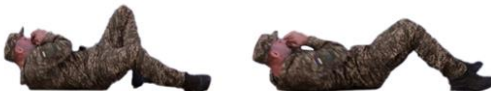
Рис. 15. Переповзання на спині

Перекати через лівий та правий боки (рис. 16) - починається з повороту голови і тіла в бік, одне плече підіймається потім за ним слідує решта тіла.