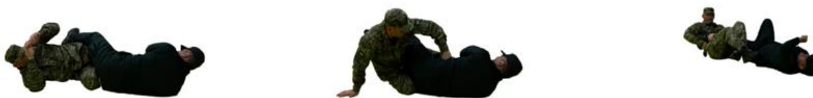
Рис. 89. Захист від важеля коліна

Захист від важеля коліна (рис. 90) – вільною ногою відштовхнути таз противника з одночасним переворотом на спину звільнивши атаковане коліно. Виконати больовий на ногу.