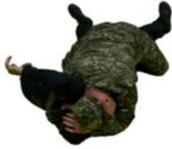
Рис. 52. Утримання зверху