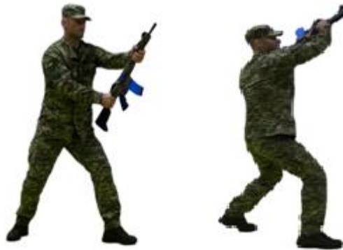
Рис. 61. Удар прикладом знизу

Удар прикладом знизу (рис. 61) - з положення готовності до бою виконати крок правою ногою вперед з одночасним нанесенням удару прикладом штурмової гвинтівки (автомату, карабіна) знизу догори в уразливу точку противника, повернутися в положення готовності до бою.