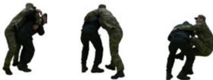
Рис. 80. Захист від кидка через плече