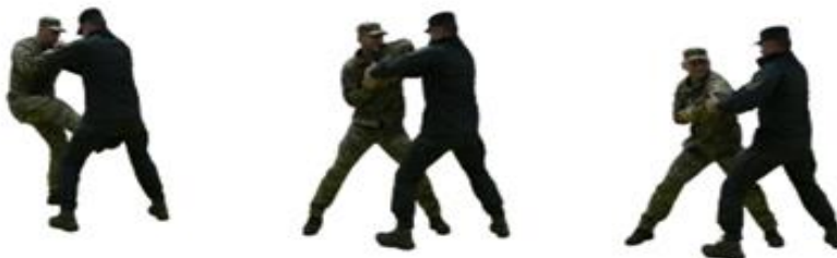
Рис. 84. Захист від важеля руки назовні

Захист від важеля руки всередину (рис. 85) – ближньою ногою перекрити ноги противника ззаду, відштовхуванням руки назад виконати кидок.