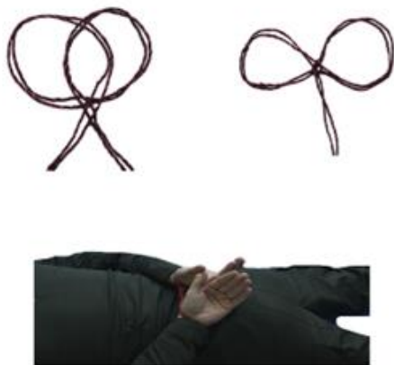
Рис. 114. Зв'язування мотузкою (види петель)

Зв'язування пластиковим хомутом (рис. 116) - звалити противника на землю і загнути руки за спину, надіти петлю хомута на зап'ястя його рук та затягнути.