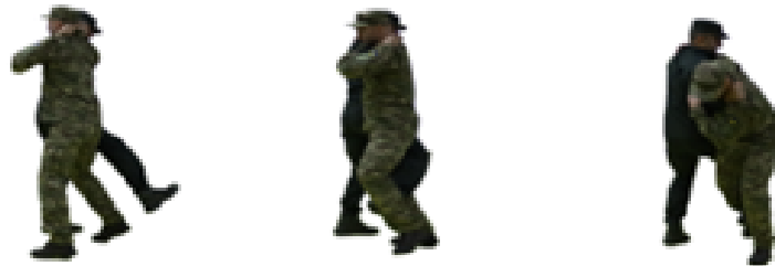
Рис. 79. Захист від задньої підніжки

Захист від кидка через стегно (рис. 81) – правою ногою виконати довгий крок по ходу руху, лівою рукою захопити одяг на спині противника, правою рукою захопити одяг на його руці ближче до плеча, лівою ногою виконати передню підсічку.