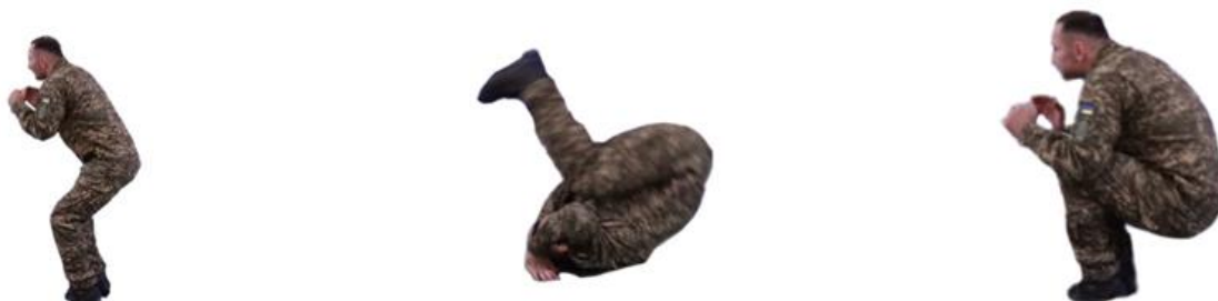
Рис. 22. Перекид назад

Перекид назад (рис. 22) – з фронтальної стійки сісти, притиснути підборіддя до грудей і, падаючи назад, згрупуватися. У момент торкання землі плечима обпертися об неї руками біля голови, перекотитися назад через голову, швидко встати і приготуватися до бою.