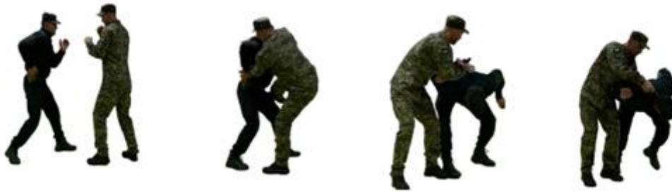
Рис. 108. Обеззброєння при спробі дістати пістолет з кобури (кишені, з-за поясу)

двома руками зверху, нанести удар ногою, виконати важіль руки досередини, обеззброїти противника.