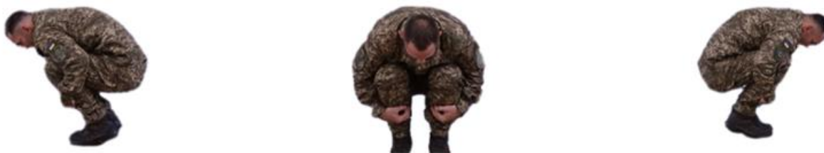
Рис. 17. Техніка групування

або вліво); перекотитися з грудей на живіт, прогинаючись у попереку. Закінчивши падіння, встати і приготуватися до бою.