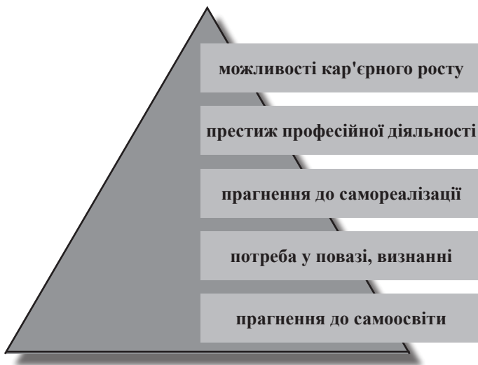
Рис. 2. Структура мотивів праці