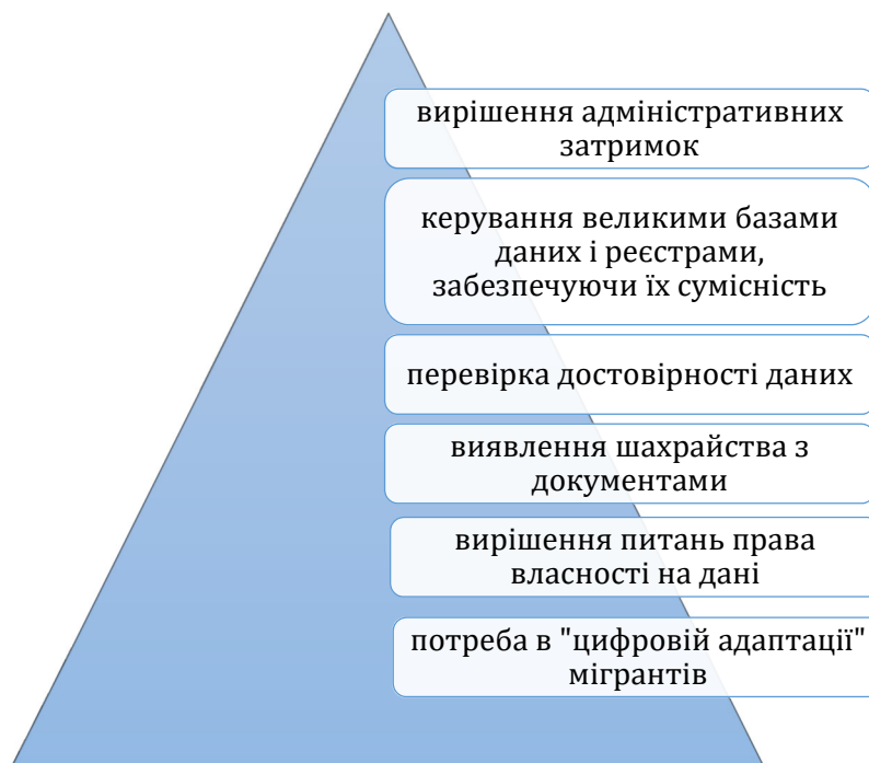
Рис. 2. Виклики процесів міграції, пов'язані з розвитком цифровізації

Штучний інтелект стає все більш важливим у сферах управління кордонами й процедур міграції та надання притулку. У Новому Пакті про міграцію та притулок Європейська Комісія вказує на важливість цифрової трансформації, зокрема щодо необхідності ефективних процедур надання притулку й інтегрованого та сучасного управління кордонами [3, с. 113]. Останні міграційні потоки й зростання популярності цифрових технологій створюють нові виклики для міграційних служб (рис. 2).