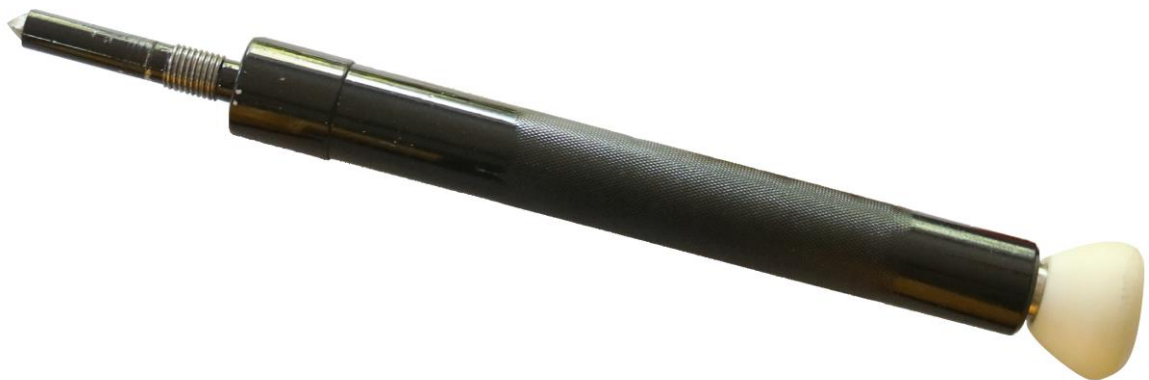
Рис. 2. Загальний вид ударного інерційного молоту

Застосування фіксуючих вакуумних присосок надає можливість здійснювати сконцентрований удар без відскоку бойка та суттєво зменшити радіус розльоту уламків скла під площею дії вакуумної присоски. Рухомі частини пристрою, а саме: шток, ударна рукоять (голівка) інерційного молотка та бойок розташовані у корпусі молота і є єдиною цільною конструкцією.