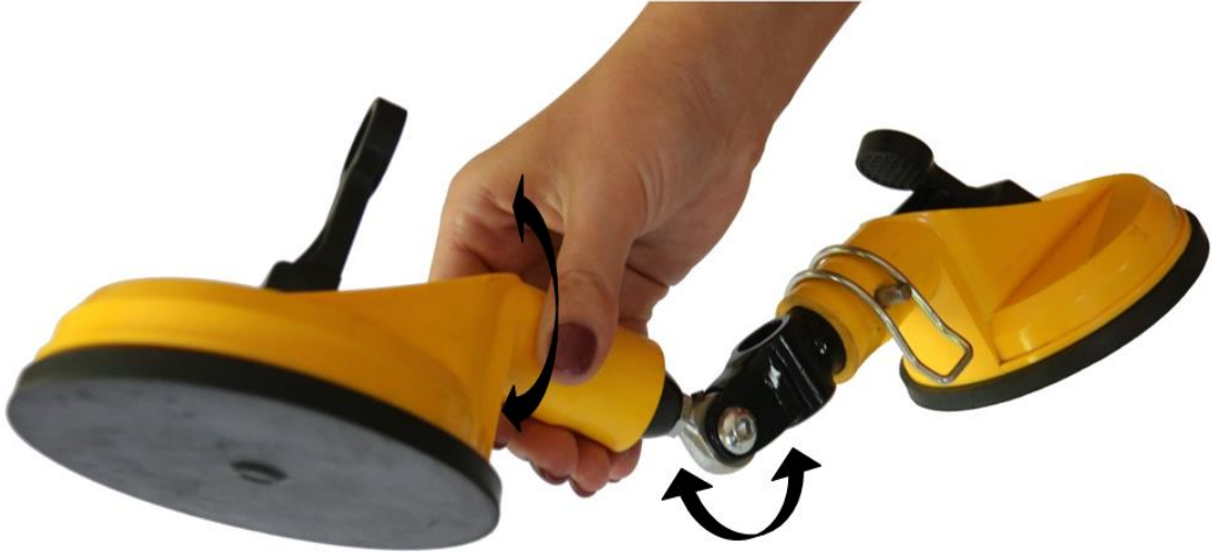
Рис. 3. Можливості обертового руху вакуумної присоски відносно осі фіксуючої рамки

для певної марки автомобіля чи року його виготовлення. Така «всеїдність» конструктивно забезпечена можливістю руху однієї присоски із забезпеченням незначного обертового руху (див. рис. 3).