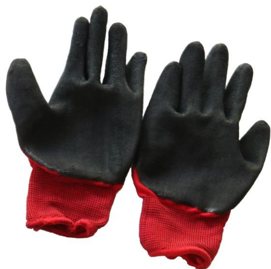
Рис. 6. Захисне обладнання для роботи з пристроєм

4) притискаючи до скла фіксуючу рамку та одночасно переміщуючи важелі на вакуумних присосках, зафіксувати рамку на поверхні скла за допомогою дії присосок;