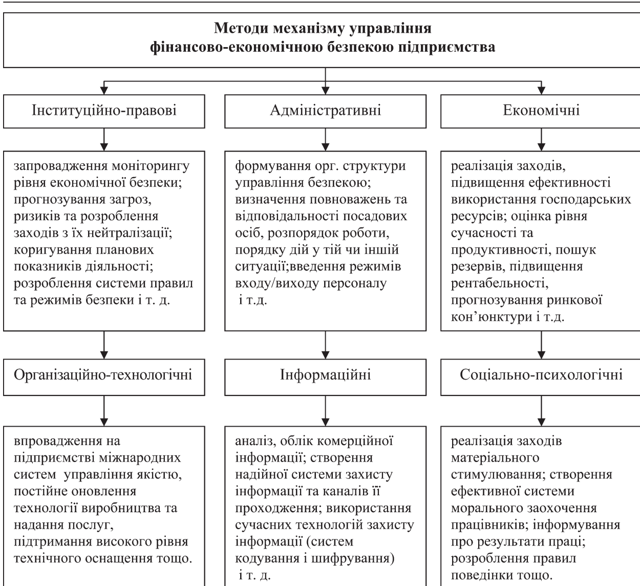
Рис. 1. Схема формування методів механізму управління фінансово-економічною безпекою підприємства (складено на основі [6, с. 229])

Аналіз поглядів різних науковців дозволив визначити досить повний перелік методів механізму управління фінансово-економічною безпекою підприємства (рис. 1).