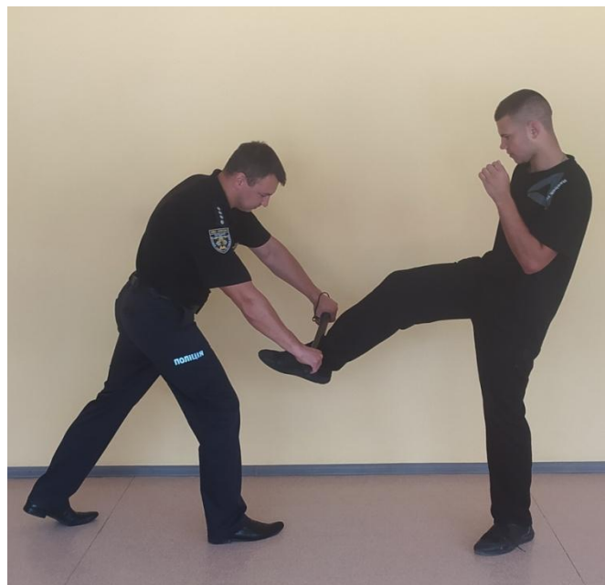
Рис. 17. Захист від удару ногою знизу

6. Захист від удару ногою знизу. Виконується підставкою середньої частини палиці вниз, назустріч удару (рис.17).