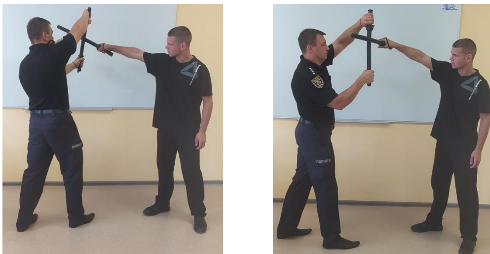
Рис.24. Способи блокування обома руками

відкритою, для запобігання її травмування. Зближуючись із супротивником, виконати коловий рух кийком, переводячи його зброю над своєю головою на протилежний бік, при цьому відкрита долоня, яка утримує довгий кінець кийка, виконує роль фіксатора, який запобігає ковзанню зброї супротивника по площині кийка. Після цього виконати серію контратакувальних дій.