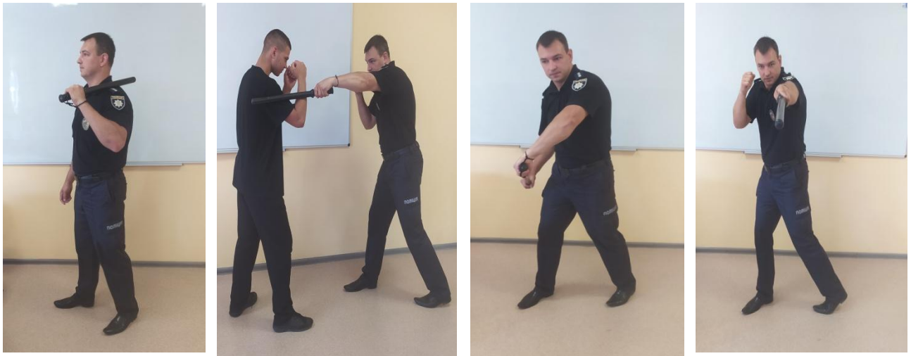
Рис. 11. Загальний вигляд нанесення удару усередину з атакуючої стійки

Комбінації ударів кийком в умовах двобою удари кийком доцільно завдавати серіями, які можуть застосовувати як на ближній і середній, так і на дальній дистанціях.