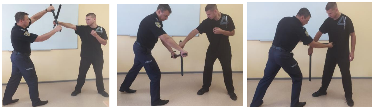
Рис.22. Спосіб блокування зверху та знизу

Спосіб 3. Здійснюючи відхід із лінії удару ліворуч під кутом 45°, заблокувати удар супротивника (рис. 22). Площина кийка під час блокування повинна бути щільно притиснута до передпліччя, повністю закривати його від контакту зі зброєю супротивника та знаходитись під кутом відносно неї.