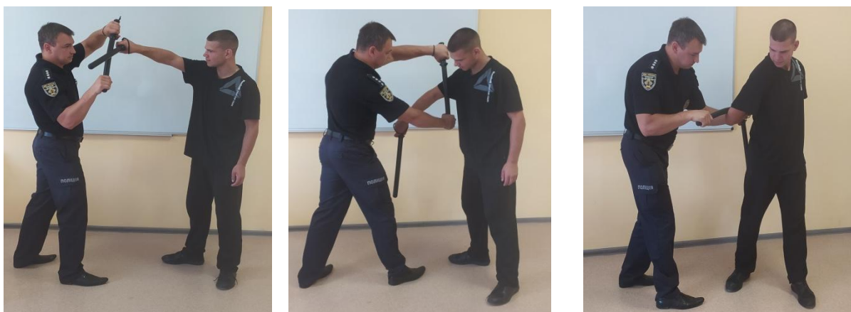
Рис.23. Способи захоплення та переходу до затримання

Спосіб 4. Здійснюючи відхід із лінії атакуючих дій ліворуч (під кутом 45 градусів) (рис. 23), виконати блокувальний удар площиною кийка назовні по зброї супротивника. У результаті таких захисних дій відбувається зміна напрямку удару, а супротивник втрачає рівновагу завдяки прискорення палиці, яку він утримував до зіткнення із землею. Після виконання захисту необхідно здійснити контратакувальні дії стосовно супротивника. Наприклад, зворотнім коловим ударом по його кінцівках або тулубу, підбити вгору його плече та перейти до затримання.