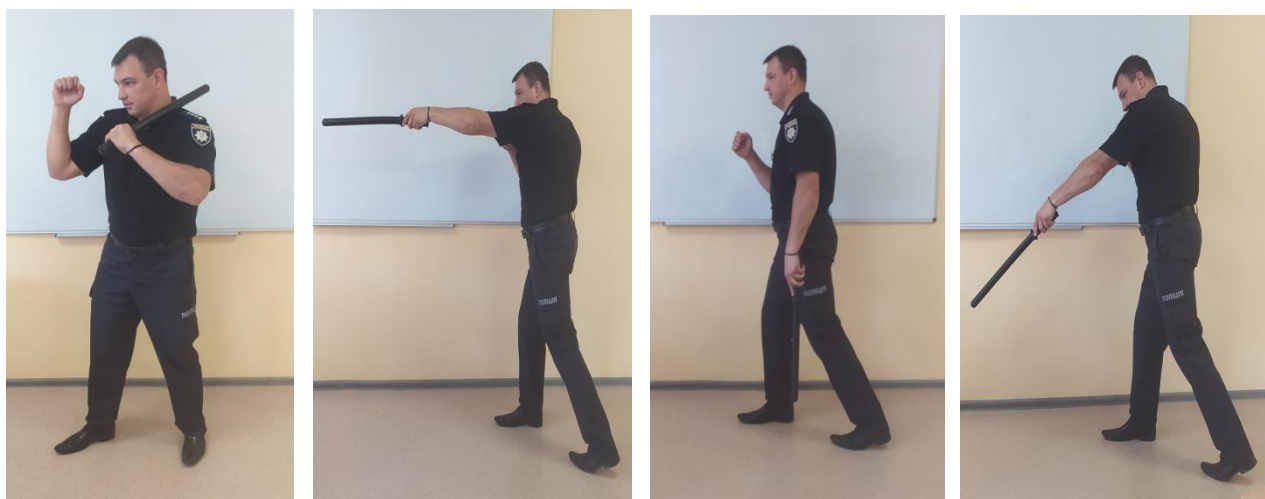
Рис. 10. Різновид ударів з атакуючої стійки

Удар зверху з атакуючої стійки (рис. 10) виконується зверху вниз завдяки швидкого скручування тулубу ліворуч і випростання озброєної руки вперед. Продовжуючи рух кийка додолу-назад, повернути його у вихідне положення.