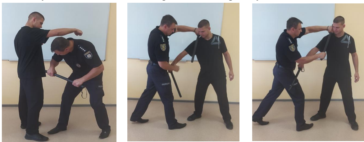
Рис.20. Види контратакувальних відволікаючих ударів

Під час блокування необхідно, щоб кийок знаходився під кутом до площини удару (рис. 19). Це обумовлено тим, щоб відбувся ковзний контакт, при якому зменшується швидкість, сила удару супротивника та змінюється його напрямок. Рух палиці супротивника, у цьому випадку, продовжується до її контакту із землею, що надає переваги в контратакувальних діях.