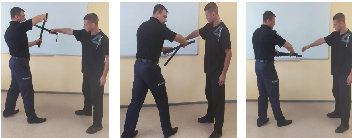
Рис.21. Способи захоплення та переходу до затримання

Спосіб 2. Після блокування удару палицею (рис. 21), необхідно захопити її лівою рукою. Заблокувати рукояткою гумового (пластикового кийка) із зовнішньої сторони кисть супротивника, яка утримує палицю, та різким рухом до себе обеззброїти його, після чого перейти до затримання.