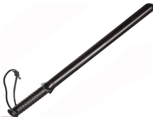
Рис.1. Загальний вигляд гумового кийка

Досліджуючи питання застосування гумових та пластикових кийків поліцейськими, військовослужбовцями Національної гвардії України, співробітниками установ виконання покарань, посадовими особи інших правоохоронних органів України, визначених законодавством, для відбиття нападу на осіб, об'єкти, приміщення, затримання особи, яка вчинила правопорушення і чинить злісну непокору законному розпорядженню, а також для припинення групових порушень громадського порядку чи масових заворушень вважаємо за потрібне навести характеристику зазначених спеціальних засобів.