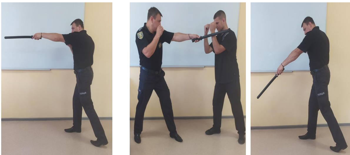
Рис. 9. Загальний вигляд нанесення ударів тильною стороною руки

зменшити швидкість руху кийка, який закінчує рух, торкнувшись правого плеча в позиції атакуючої стійки.