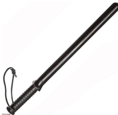
Рис. 4. Кийок гумовий ПР -73

Гумовий кийок ПР-73 – один з найпоширеніших засобів самозахисту. Він може використовуватися в спеціальних підрозділах поліції для розгону мітингувальників і припинення заворушень. Крім того гумовий кийок має велику популярність у спеціальних служб - охорони банків, інкасаторів і інших спеціальних підрозділів.