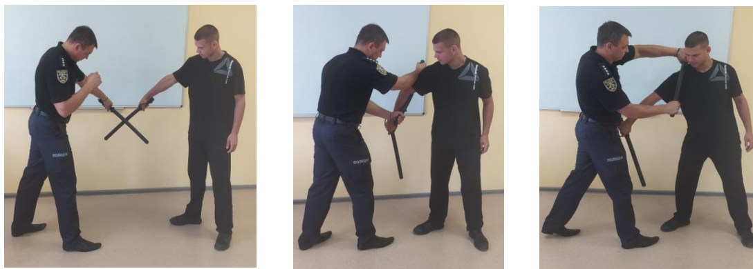
Рис.25. Способи блокування та переходу до контрнатупу

Спосіб 2. Зміщуючись від удару праворуч (під кутом 45 градусів), виконати блокувальний удар площиною кийка всередину по зброї супротивника та продовжити його рух по колу траєкторією вниз назовні (рис. 25). У результаті таких захисних дій відбувається зміна напрямку удару, а сам супротивник втрачає рівновагу завдяки прискорення палиці, яку він утримує. Після захисту контратакувати супротивника зворотним коловим ударом по кінцівках та перейти до затримання.