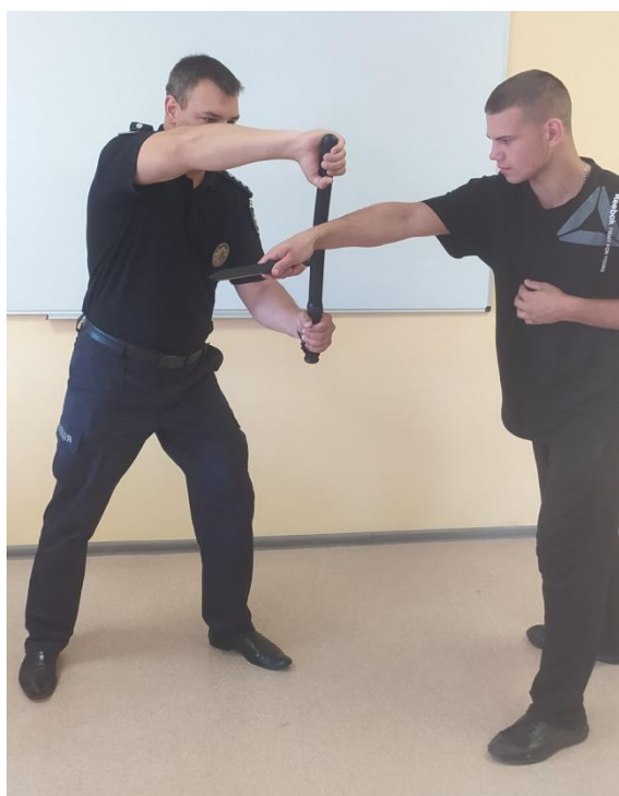
Рис. 16. Захист від прямого удару рукою

5. Захист від прямого удару рукою, ножем, предметом в обличчя, верхню частину тулуба. Виконується отбиванням ударної руки всередину середньою частиною палиці з поворотом тулуба (рис.16).