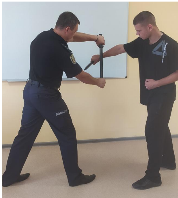
Рис. 15. Захист від удару збоку рукою

частину тулуба, так і в нижню виконується підставкою середньої частини палиці в сторону руки, що б'є (рис.15).