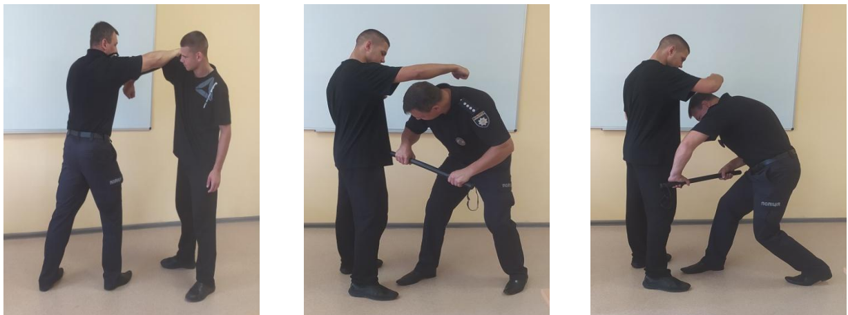
Рис.28. Відхід від удару «ближньою» рукою з подальшою контратакою

Для захисту від прямого удару «ближньою» рукою в голову доцільно виконати ухил назад ухил в бік або відійти з лінії удару праворуч під кутом 45^{\circ} і зближувачись із супротивником, відбити його атаквальну руку площиною кийка (рис. 28). Після цього контратакувати супротивника коротким кінцем кийка в тулуб, рубаючим ударом по атаквальній руці, або круговим ударом по нижній кінцівці.