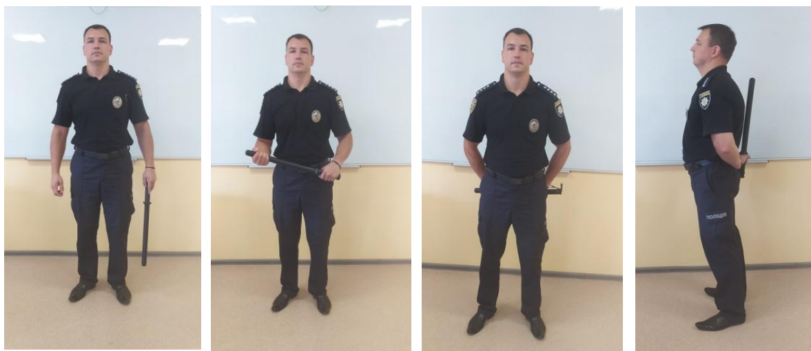
Рис. 6. Різновид стійок з гумовим (пластиковим) кийком

Кийок в одній руці опущений долу, затиск прямий (може бути й зворотній), ремінець надягнутий на зап'ясток. Довжина ремінця підбирається таким чином, щоб рука легко звільнялася від нього. Також можна використовувати затиск кийка двома руками, та прихованість кийка за спиною.