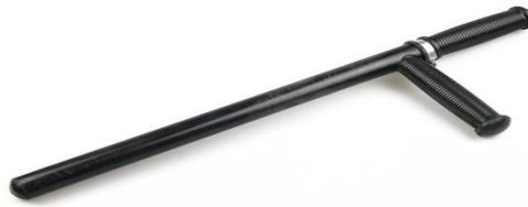
Рис. 3. Загальний вигляд кийку пластикового кийка типу «Тонфа»

Пластиковий кийок «Тонфа» призначений для самозахисту правоохоронця, подолання опору та контролю дій правопорушника. Він виготовлений зі спеціальної ударо- та морозостійкої пластмаси або з металевого каркасу в еластичному пластмасовому покритті. За допомогою такого кийка при наявності певних навичок поліцейський може не тільки чинити фізичний вплив на правопорушника, відбивати напад або припиняти непокору, а і роззброїти нападника, конвоювати його до відділу поліції, а також, у разі крайньої необхідності, завдати значного ураження злочинцю.