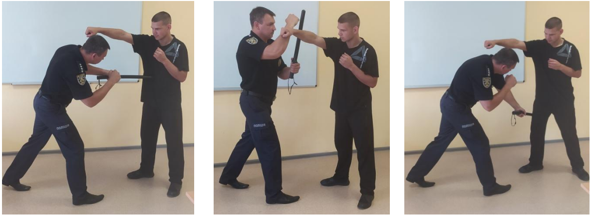
Рис.27. Відхід від удару рукою з подальшою контратакою