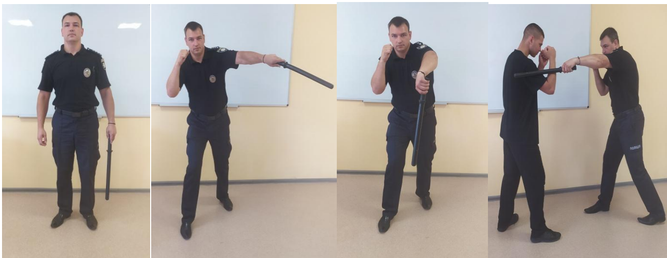
Рис. 8. Загальний вигляд нанесення ударів із захопленням кийка

Удари цього типу застосовують на дальній і середній дистанціях; вони можуть виконуватися зі стійки очікування, а також із бойових – атакуючої та захисної. Удар усередину зі стійки очікування (рис. 8) здійснюється шляхом енергійного скручування тулуба ліворуч і винесення озброєної руки вперед. Залежно від зони нанесення удару, кийок спрямовують по нижньому або по верхньому рівнях. У кінцевій фазі удару кийок зупиняється лівою долонею або торкається лівого стегна.