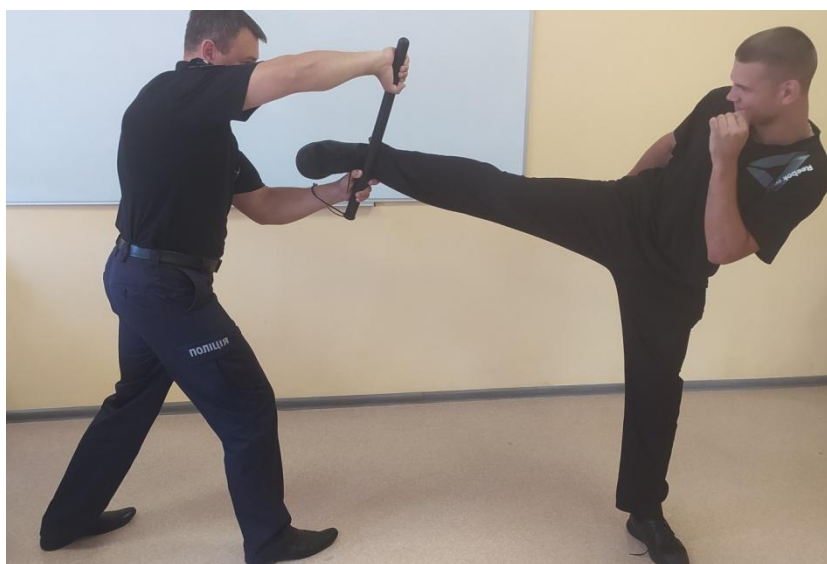
Рис. 18. Захист від удару ногою збоку

7. Захист від удару ногою збоку. Виконується підставкою середньої частини палиці в сторону, назустріч удару (рис.18).