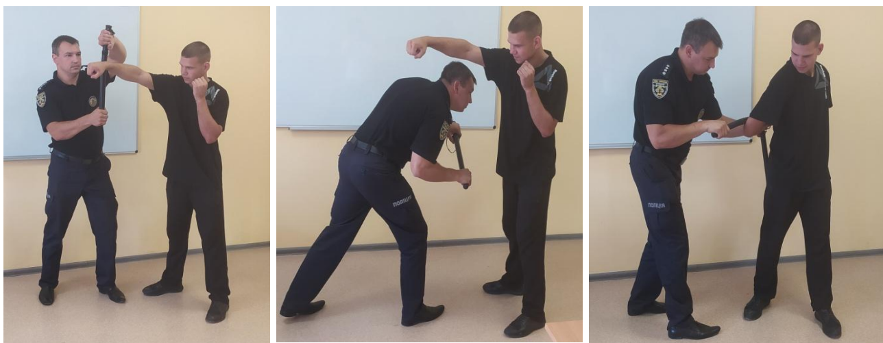
Рис.26. Відхід від удару рукою з подальшим затриманням

Спосіб 1. Виконати відхід із лінії удару ліворуч під кутом 45 градусів та зближуючись із супротивником, здійснити відбив його атакуючої руки площиною кийка. Продовжуючи рух руки супротивника вниз-назовні, здійснити підбивання його плеча вгору (рис. 26) та виконати затримання загином руки за спину.