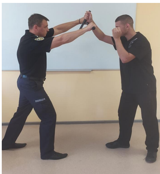
Рис. 12. Захист від удару зверху

1. Захист від удару зверху рукою, ножем, ін. предметом. Виконується підставкою середньої частини палиці вгору (рис.12).