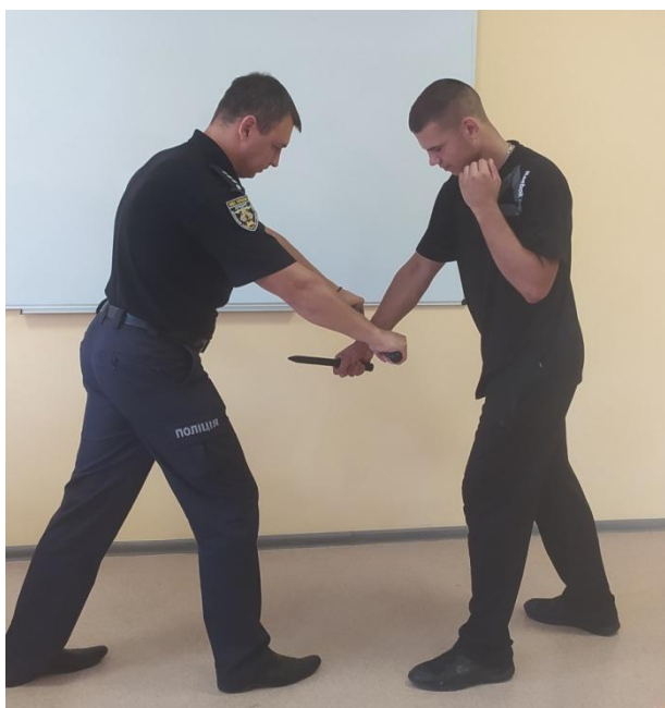
Рис. 14. Захист від удару знизу рукою

3. Захист від удару знизу рукою, ножем, предметом. Виконується підставкою середньої частини палиці вниз назустріч удару (рис. 14).