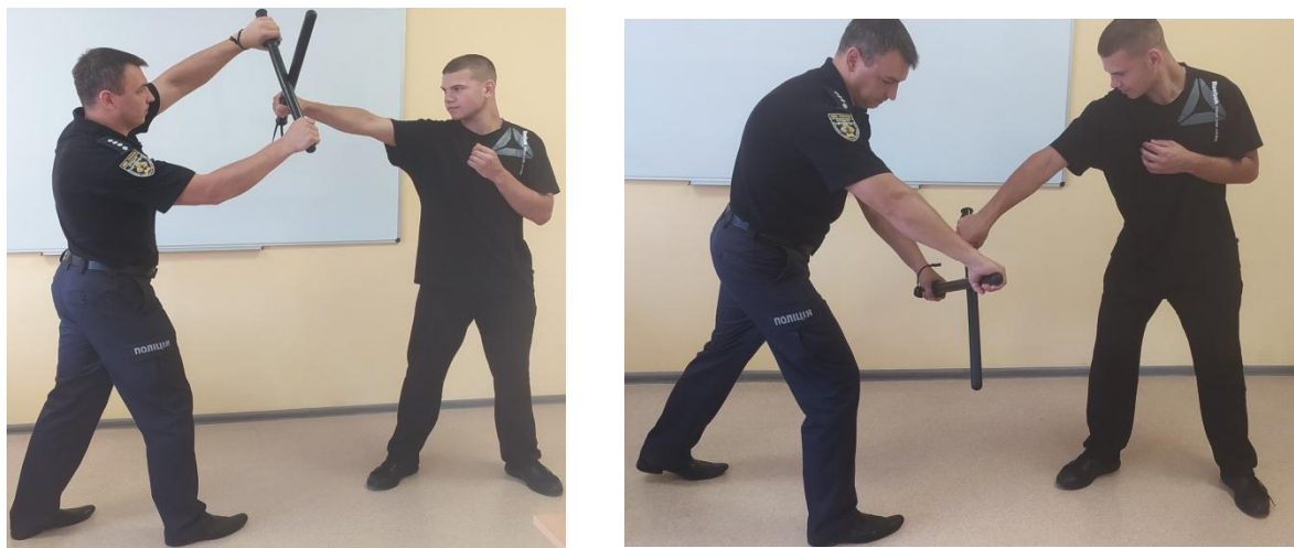
Рис.19. Види блокування

Спосіб 1. Здійснити відхід з лінії удару ліворуч-уперед і виконати підставку кийка під палицю супротивника. При цьому слід намагатись, щоб контакт відбувся не з кінцем палиці нападника, а з ділянкою наближеною до точки захоплення – це знижує ймовірність травмування рук у цій фазі захисних дій.