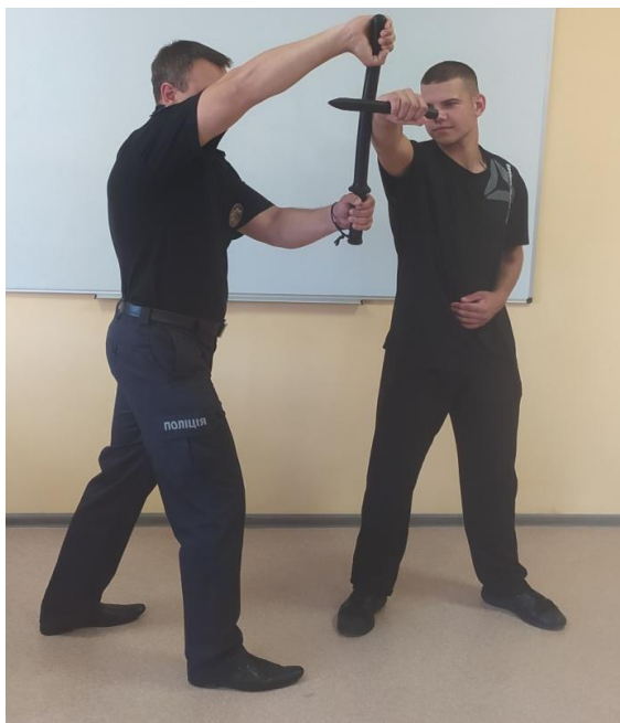
Рис. 13. Захист від удару навідріг рукою

2. Захист від удару навідріг рукою, ножем, предметом. Виконується підставкою середньої частини палиці в сторону (рис.13).