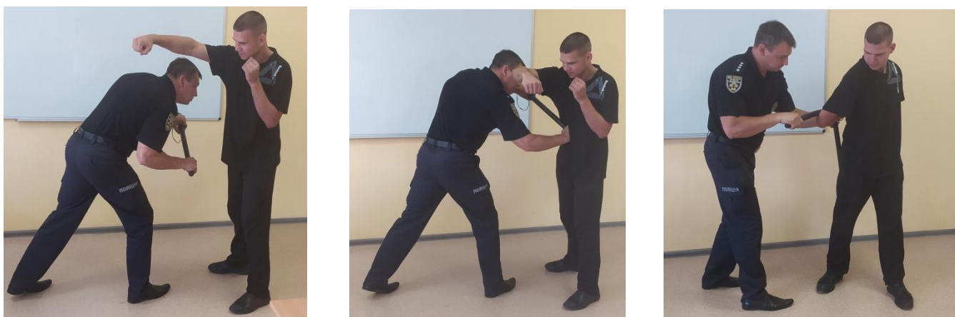
Рис.29. Відхід від удару рукою збоку з подальшою контратакою та затриманням

Виконати пірнання під атакувальну руку супротивника та контратакувати його серією ударів в тулуб (рис. 29), після цього перейти до затримання використовуючи больові прийоми.