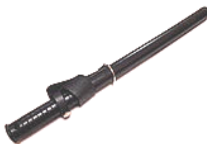
Рис.2. Загальний вигляд гумового кийка ПГ-М

Гумовий кийок (ГК) і пластиковий кийок типу «Тонфа» є багатофункціональними спеціальними засобами активної оборони, які призначені для самозахисту правоохоронця, придушення опору та контролю дій правопорушника. Гумові кийки ПР-73 (ПГ-М) та ПРС виготовлені з пружної гуми та мають зручну рукоятку.